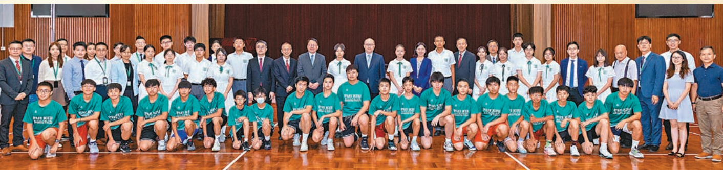
◆宣讀習近平主席回信後，鄭雁雄與現場嘉賓和師生代表合影。