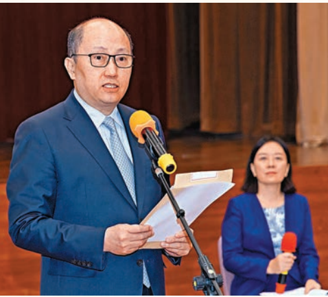
◆鄭雁雄受中央委託到學校宣讀回信。

香港文匯報訊 據中聯辦網訊，7月24日，習近平主席給香港培僑中學高一年級全體學生回信，肯定同學們在來信中深刻體會到身為中國人的自豪、身為香港年輕一代的使命與擔當，強調愛國主義是中華民族精神的核心，廣大香港同胞素有愛國愛港光榮傳統，這是「一國兩制」行穩致遠的重要基礎，勉勵大家把讀萬卷書與行萬里路結合起來，厚植家國情懷，錘煉過硬本領，早日成長為可堪大任的棟樑之才。25日，中央政府駐港聯絡辦主任鄭雁雄受中央委託，來到培僑中學宣讀回信。署理行政長官、政務司司長陳國基，中聯