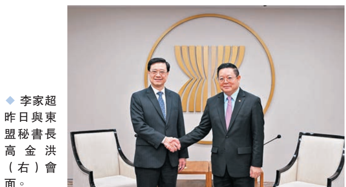
◆李家超昨日與東盟秘書長高金洪（右）會面。