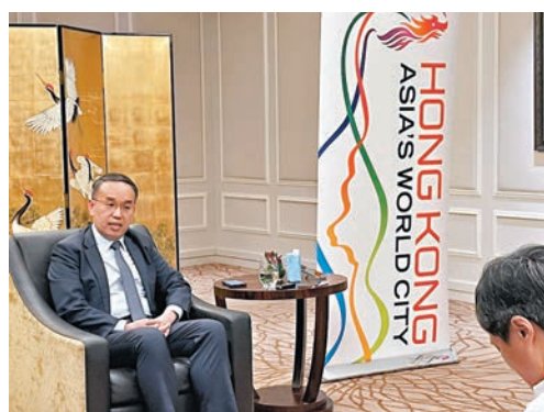
◆許正宇日前在新加坡接受當地媒體採訪。

能，就是透過互聯互通項目包括股票通、債券通、跨境理財通，以及最近的互換通，豐富了內地和國際（包括新加坡）投資者的投資和風險管理選項；還有不斷為離岸人民幣業務增加產品種類和流動性，讓國際投資者更全面把握