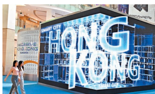
◆正在印尼雅加達舉行的「香港—沉浸式之旅」巡迴展覽。圖為展覽上展示的裸眼3D效果。

香港文匯報訊 據香港特區政府新聞網消息，特區政府在東盟國家舉辦的巡迴展覽「香港—沉浸式之旅」，於本月23日至29日在雅加達大型商場Gandaria City Mall舉行。展覽以「香港—實踐理想，開創未來」為主題，展示香港獨有的實力、優勢和機遇，並且誠邀東盟地區的商務和休閒旅客到訪香港。