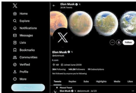
◆馬斯克的賬戶換上新標誌。

《衛報》指出，廣告收入是Twitter原本的主要收入來源，然而馬斯克入主後，平台審核標準頻繁變更，對廣告商的吸引力大不如前，馬斯克亦承認平台廣告收入較收購前下滑50%。若要徹底改革商業模式，首先要實現盈利、擁有穩定的現金流，如今即使馬斯克拋售大量名下車企Tesla的股票為Twitter「輸血」，短期內也難以扭虧為盈。 美國有線新聞網絡(CNN)還提醒，馬斯克入主後頻繁變更內容審核標準、推出需付費認證的「藍鳥」，又一度限制用戶每日瀏覽帖文數目等做法，已引來不少Twitter忠實用戶不滿。社媒上也不時見用戶抱怨Twitter虛假信息增多、使用體驗欠佳。如今撤換熟悉的「藍鳥」標誌，更讓許多用戶的印象分大減，「他的做法如同殺死Twitter，再為它套上名為「X」的空殼。」 英國數碼營銷機構Accuracast總經理迪維查認為，廣告商應審慎觀望Twitter的轉型，「馬斯克改變標誌不會馬上讓廣告商回流，但或會有人看好一個貌似合理的萬能應用程式前景。我們還是不建議廣告商立即加碼投資，但我們會密切關注其後續進展。」