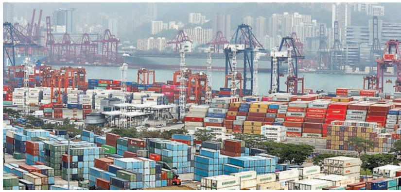
◆有分析估計，今年本港全年整體出口跌幅可能介乎5%至10%。

特區政府發言人表示，在外圍環境疲弱下，今年6月商品出口貨值按年進一步下跌。輸往內地、美國及歐盟的出口均減少，輸往大部分其他主要亞洲市場的出口繼續錄得不同程度的跌幅。展望未來，在環球經濟增長減慢的影響下，香港的出口表現短期內會繼續顯著受壓。政府會密切留意情況。