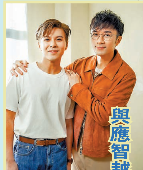
與應智越合唱好疲勞 古巨基費心發掘其新唱腔