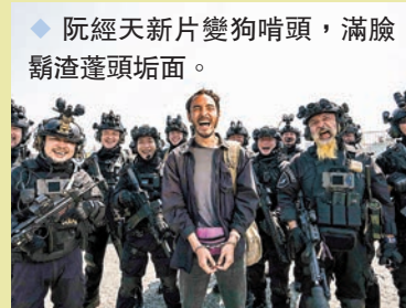
◆ 阮經天新片變狗頭，滿臉鬍渣蓬頭垢面。

預告也首度公開演出陣容，電影由李烈監製、黃精甫執導，雙影帝阮經天及陳以文、金馬獎最佳男配角袁富華、金鐘獎男配角李李仁、金鐘視帝游安順及謝瓊煖、王淨、曾珮瑜等人演出。電影將於10月6日上映。