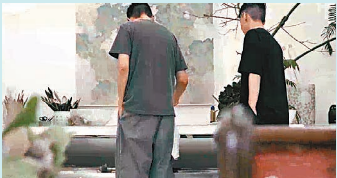
◆ 劉德華在研究藝術創作。