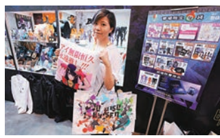
◆羚邦集團今年於會場內推出多款動漫產品。