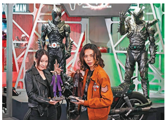
◆《幪面超人》黑日和影月在動漫節率先展出。

節推出周星馳電影《食神》正式授權系列產品，包括269元的「爆漿瀾屎牛丸」Tee及售價69元、內含6粒「爆漿瀾屎牛丸」彈彈波的罐裝玩具，場內還會接受預訂一套7隻《食神》角色公仔。URDU對有關產品期望十分高，並相信連同其他產品，今年的銷情可按年增長30%至40%並回復至疫情前水平。