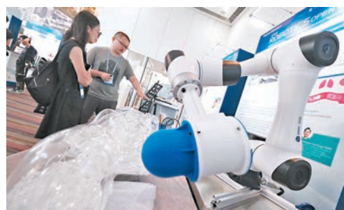
▲用於血管內介入治療的微型機械人平台。香港文匯報記者涂穴攝

▲「自動化樓宇結構檢查和管理平台」，以無人機及人工智能技術檢查建築物內外的情況，協助物業管理維修。香港文匯報記者涂穴攝