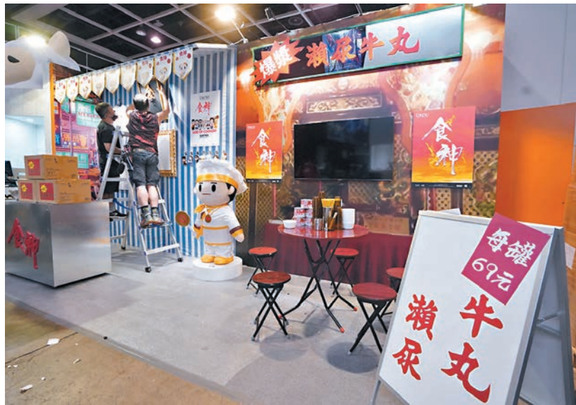
◆URDU將於動漫節推出周星馳電影《食神》正式授權系列產品，包括「爆漿瀾屎牛丸」Tee及「爆漿瀾屎牛丸」彈彈波罐裝玩具。