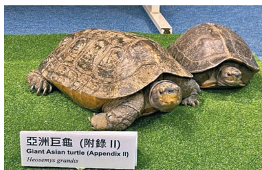
◆檢獲的兩隻亞洲巨龜

他表示，人工智能、物聯網(IoT)及金融科技的最新發展，有助院校開發真正的二十一世紀方案，體現院校成員的創新精神。兩項措施預計可於今年秋季在8所成員院校完成安裝，並會透過舉辦工作坊、各類挑戰賽及獎勵計劃等方式全面推廣，以培養學生自攜餐盒及建立良好用水習慣。