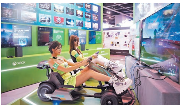
◆Xbox將帶來首次現身香港的Segway小型電動車，入場者可透過連動大玩王牌賽車遊戲《極限競速：地平線5》。

主機 Xbox Series X|S 推出「舊機 Trade-in 優惠」，玩家能以 PS4 等舊機換取優惠價換購 Xbox Series X 或 Xbox Series S，最高可享1,400元折扣。