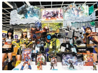
◆孩之寶將優先發售多款《變形金剛》系列產品。

香港動漫電玩節自然少不了電玩元素。其中，Xbox將帶來首次現身香港的Segway小型電動車，入場人士可透過連動大玩王牌賽車遊戲《極限競速：地平線5》。為配合第二期消費券，更首度為次世代