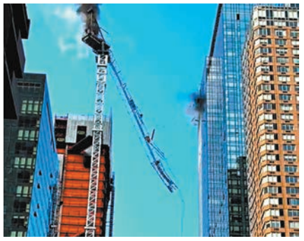
天秤墜落一刻。

消防部門調查人員初步分析表明，火警可能由天秤內液壓管路破裂引起。建築專員奧多表示，這座天秤用於建造一座54層高的綜合用途大樓，當局將調查參與天秤操作的各方。