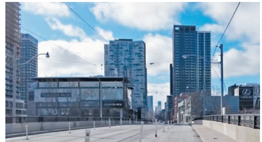
杜魯多的房屋政策多年未改善，惡評如潮。

是常見的做法。在今次改組中，副總理兼財長方慧蘭、外長趙美蘭及創新、科學和工業部長商鵬飛保留原職，而內閣中唯一華裔伍鳳儀續任國際貿易、出口推廣及經濟發展部長。