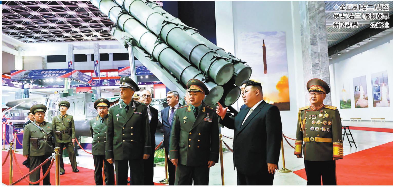
金正恩(右二)與紹伊古(右三)參觀朝鮮新型武器。

強純男在歡迎紹伊古的宴會上致辭稱，在同仇敵愾的歷史鬥爭、反對侵略戰爭的共同戰線中，兩國軍隊和人民進一步鞏固團結，俄方此方有望為炫耀其威力創造契機。他還說，朝方全力支援俄軍和人民的正義戰爭，並重申朝軍將為反帝鬥爭加深合作和團結。紹伊古表示，朝鮮人民軍不僅靠地保衛朝鮮免受外部威脅，還積極參加經濟建設和提升人民生活的事業，恭維稱「世界最強軍隊」。