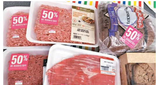
物價飛漲，減價貨成為加拿大人首選。