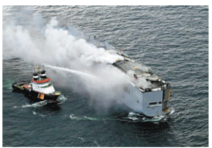
荷蘭海岸防衛隊派船向着火貨輪射水以使其冷卻。

旦電池過熱並發生「熱失控」，情況會變得很危險，指電池中的化學反應會產生氣體，使電池膨脹，提高失火風險。