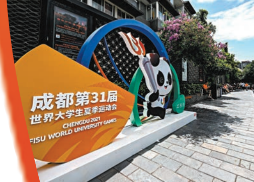
◆ 成都第31屆世界大學生夏季運動會 CHENGDU 2023 FISU WORLD UNIVERSITY GAMES