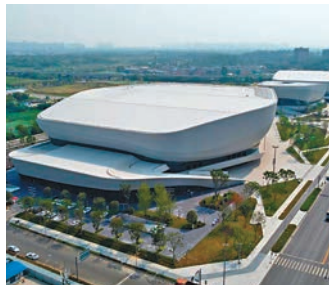
◆ 高新體育中心體育館

至2022年底，成都擁有體育場地設施6.41萬個，已建成5,000多公里長的天府綠道，植入體育設施1,700多處，全年舉辦全民健身活動6,000餘場次。當中，如成都東安湖大運會場館、鳳凰山體育公園、香城體育中心、高新體育中心體育館等。兩輛新一代「智軌列車」在四川成都快速公交K7線載客試運行，起訖點為五桂橋往返東安湖站。「智軌列車」為廣大民眾提供「綠色、低碳、環保」出行同時，也方便民眾前往東安湖體育公園場館觀看賽事，助力成都大運會。智軌就是智慧軌道快運系統，通過中央控制單元指令，精準控制列車在既定虛擬軌跡行駛，最高時速可達70公里，無需鋪設有形軌道，可在城市道路上靈活行駛。