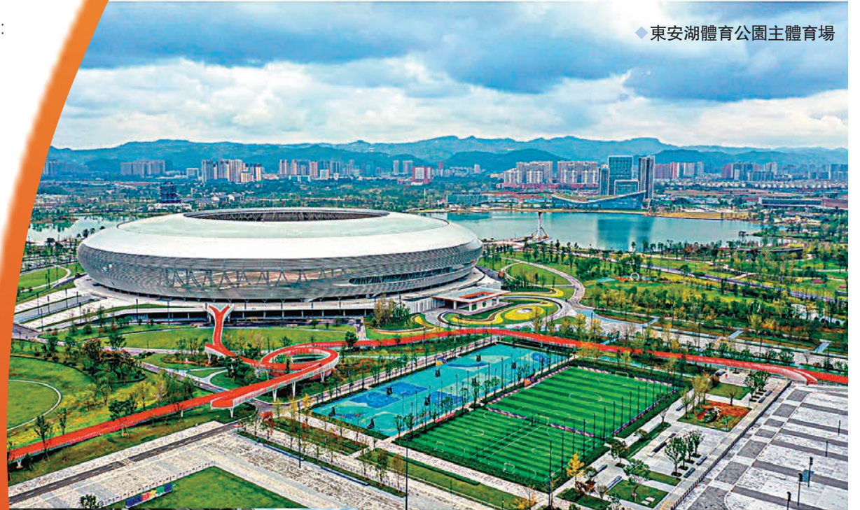
◆ 東安湖體育公園主體育場