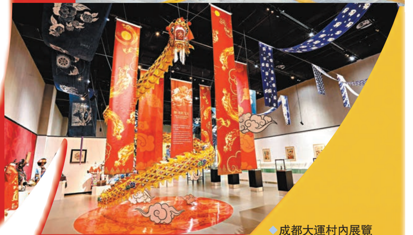
◆ 成都大運村內展覽