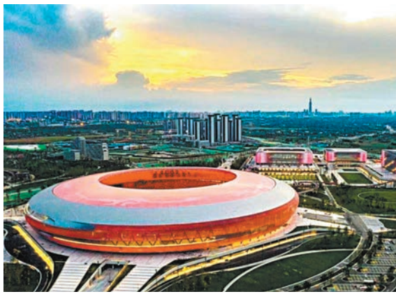
◆ 黃昏下的成都東安湖大運會場館