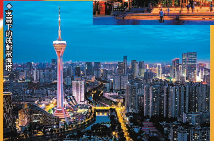
◆ 夜幕下的成都電視塔。