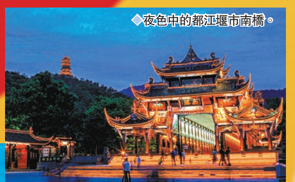
◆ 夜色中的都江堰市南橋。