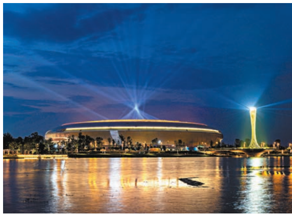
◆ 夜幕下的東安湖體育公園主體育場