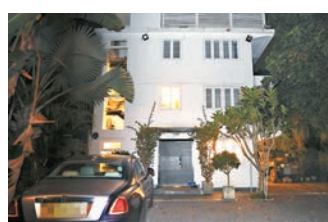
◆西貢鹿尾村路一幢三層高獨立屋被爆竊,損失逾200萬元。

改期或退票安排方面,港航建議旅客在香港航空網站,使用「不正常航班改期服務」自助提交改期申請;或於網站提交「退票申請」;經旅行社購票的旅客則要聯絡相關旅行社,查詢相關票務事宜。