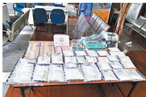
◆警方在荃灣檢獲11公斤氯胺酮毒品及一批包裝工具。

香港文匯報訊(記者 蕭景源)警方前晚(29日)在荃灣進行掃毒行動,拘捕一名販毒內地男子,在其身上及副房單位搜獲共11公斤氯胺酮(K仔)毒品,市值約560萬元。行動中亦檢獲現金、點鈔機、電子磅、透明膠袋、膠袋封口機等包裝工具。