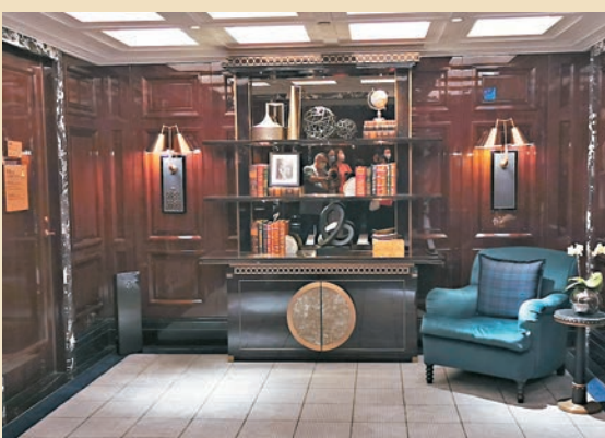
◆樓層的走廊位、燈、藝術品擺設，都充滿英倫風格並帶有碧咸的品味喜好。