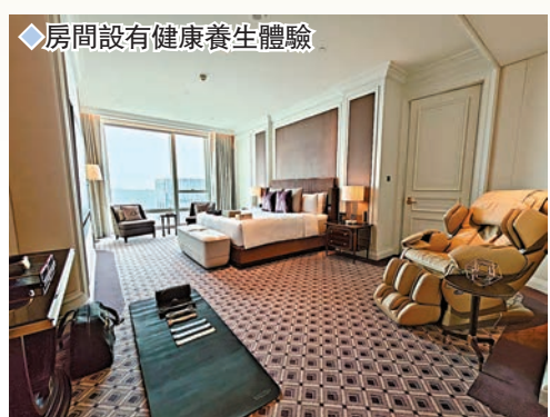
◆房間設有健康養生體驗

位於路氹金光大道核心地帶的倫敦人御園，為賓客帶來英倫奢華及個性化住宿體驗。作為澳門倫敦人的專屬度假勝地，倫敦人御園設有368間超豪華套房，分為一房式至四房式，面積由121至389平方米。下榻於此，賓客可享受皇室般的倫敦高端宅邸體驗，管家團隊細緻入微地貼心服務，量身定製的健康養生及休閒體驗以及精緻餐餐體驗。倫敦人御園的套房由屢獲殊榮的梁志天設計集團打造，以現代的手法反映出英國豐富的文化底蘊，融入迷人的設計元素與大膽創新的細節，盡顯英式懷舊風格。另外，當中的華庭特別為賓客提供英式專屬會所的體驗，專屬會所面積逾1,100平方米，極致的宅邸室內裝潢、貼心的服務及