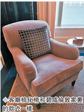
◆客廳梳化椅和碧咸倫敦家裏的款式一樣