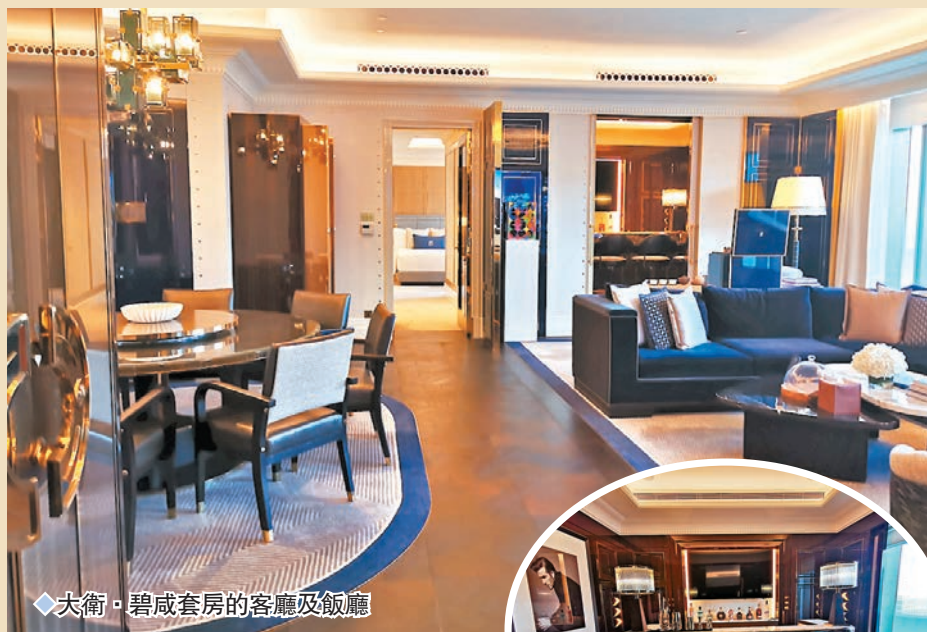
◆大衛·碧咸套房的客廳及飯廳