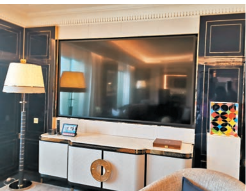
◆客廳右邊這個藝術品是藝術家足球圖案構成大家看得出嗎？