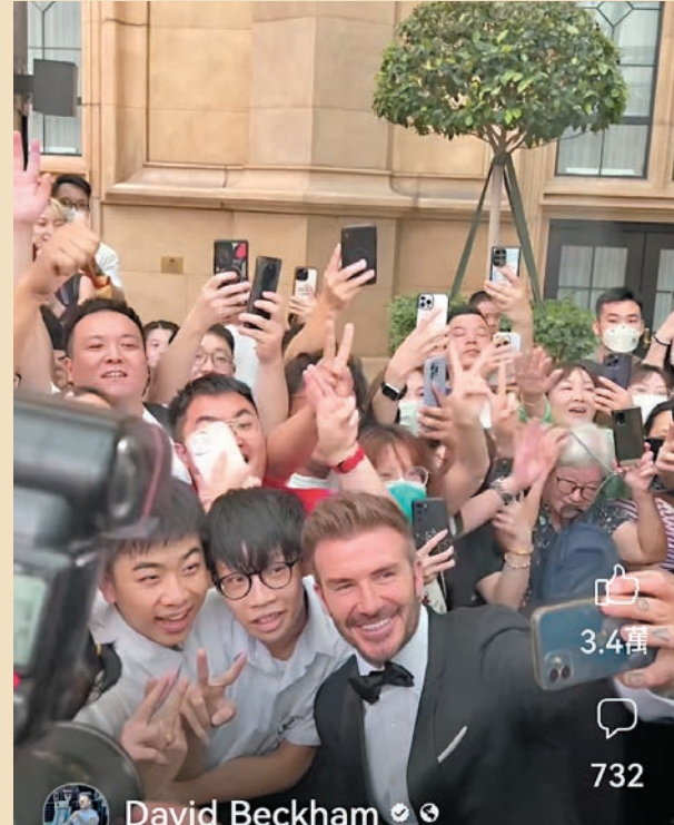
◆早前碧咸出席澳門倫敦人酒店開幕時被大批年輕男粉絲包圍要求合照。