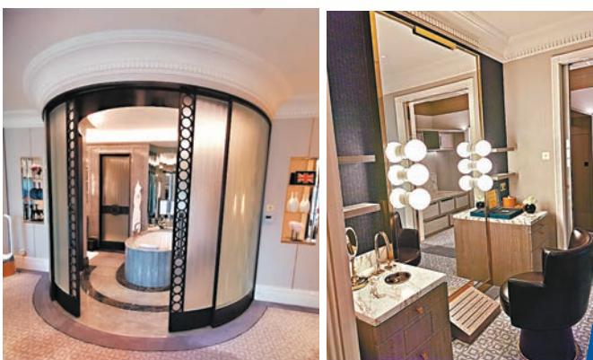
◆主人房有獨特的按摩池