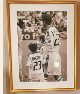
▲▲走廊和房間內都有碧咸的相片

在澳門也恍如在倫敦的家一般舒適。如讓空間散發碧咸個人獨特風格和成熟魅力，鍾意碧咸和英國的朋友一定喜歡！而且，碧咸將自己獨一無二的風格和品味融合於套房設計之中，入住的賓客將步入他的豪華生活方式，沉浸在獨一無二的奢華體驗中。筆者在參觀途中，看到樓層的走廊位、燈及藝術品擺設等，都充滿英倫風格和帶有碧咸的品味喜好。更甚是，在2021年國際酒店及地產大獎中，大衛·碧咸套房榮膺「亞太地區最佳酒店套房」殊譽。澳門倫敦人酒店提供近600間套房，包括由香港梁志天設計集團精心打造75平方米的路易套房及維多利亞套房，以及113平方米的溫莎套房，套房具備個性化。套房的前廳獨具匠心如畫廊般的設計，讓人感覺清新而不失高尚；室內採用經典黑白配色、皇家紋章飾框、頭戴皇冠的獅子雕像等各種鑲嵌工藝及細節