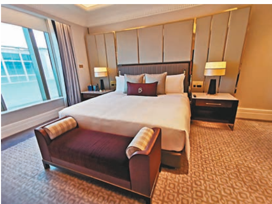
◆大衛·碧咸套房中的主人房

為設計特色，均散發着溫暖如家的感覺。房間則用上感覺平靜柔和的灰色及米白色為主色調，令人彷彿置身於倫敦舒適的頂層公寓或閣樓公寓一樣。華麗實用的起居空間擺放着彰顯格調的切斯特菲爾德梳化和真皮高背扶手椅，以及一系列唯美細膩的畫作和攝影作品，營造出當代倫敦流行藝術畫廊的氛圍。