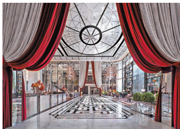
◆酒店大堂高雅宏偉

「澳門銀河」宣布與雅高集團於今年7月攜手呈獻澳門銀河萊佛士，讓尊尚賓客率先感受多個餐飲場所及物業內其他超凡體驗，並將於8月16日正式開始試業，向公眾全面揭露萊佛士的魅力所在。另外，更多特色餐廳、酒吧及水療中心將隨着於年底前舉行的盛大開幕一同亮相。雙方聯手打造的澳門銀河萊佛士首度登陸澳門，這座全澳最新的奢華物業更標誌着「澳門銀河」的第7家酒店品牌落成，為這座全球最大型之一的綜合度假城再增設約450間奢華套房，將澳門的奢華酒店推向新高度。澳門銀河萊佛士在為百年奢華品牌萊佛士寫下最新篇章之餘，更將把澳門酒店業的精緻奢華體驗提升至更高維度。自1887年品牌成立以來，萊佛士一直是奢華酒店住宿和超凡體驗的代名詞，並為無微不至、貼心打造和熱情真摯的服務賦予全新定義。作為品牌的全新傑作，澳門銀河萊佛士將承傳萊佛士的著名管家服務，務求令個人化的賓客體驗提升到前所未有的新維度。