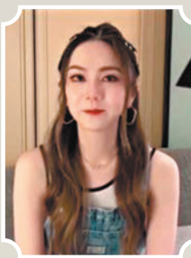
◆鄧紫棋雙眼通紅含淚拍片。

香港文匯報訊（記者 凡文）李玟在演藝圈內人緣極佳，多位藝人好友包括成龍、劉德華、張學友、林俊傑、莫文蔚、蕭敬騰、杜德偉、鄧紫棋、王力宏、陶喆、蔡依林、黃曉明、侯佩岑、梁靜茹、還有名導李安等人都錄製影片向CoCo致哀，以及憶述相處點滴，在靈堂上播出。對於CoCo的離開，群星表示相當不捨。