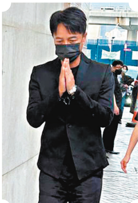
◆李克勤到場時雙手合十示意不受訪。