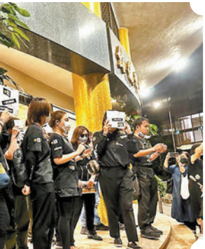
▲10多名歌迷昨晚身穿黑衫，高呼：「把CoCo還給我們！」

晚上10時許，10多名歌迷身穿清一色黑衫，衫上有標語貼紙，寫上「忘恩負義」、「宇宙渣男」、「昇返CoCo我哋！」等。眾人公祭後離場，並隨即站在殯儀館正門唱歌，其後齊聲以普通話高呼：「把CoCo還給我們！」說畢就離開。