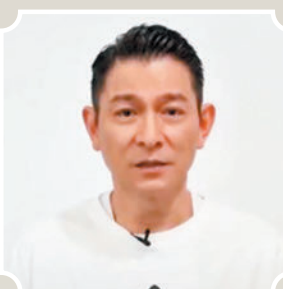
◆劉德華大讚李玟天真善良。