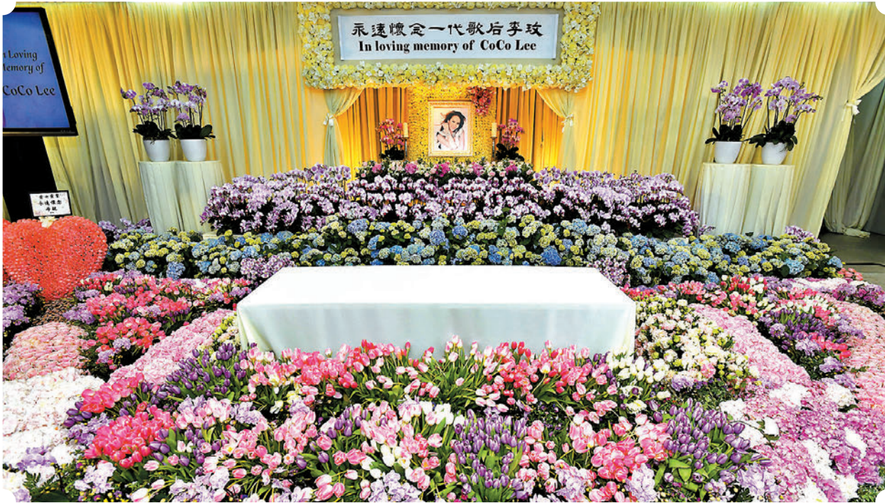
◆靈堂內擺滿了鮮花，當中以白色、粉紅色及李玟生前最愛的紫色花為主。