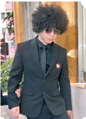
◆曾比特離開時神情哀傷。