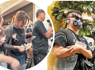
▲有粉絲拜祭後激動爆喊。