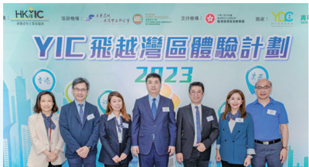
◆「飛越灣區體驗計劃2023」啟動禮上主禮嘉賓合照。

據了解，「飛越灣區體驗計劃2023」獲近一百名香港學生報名參與，經過嚴格的面試遴選，最終選出了12名在內地高校就讀的香港學生於7月11日至8月17日期間到深圳、東莞、中山、廣州、江門等地進行為期四星期的實習。期間，協會特地邀請了香港駐粵經濟貿易辦事處主任蘇惠忠、港區全國人大代表林至穎以及中山市及江門市政府官員代表，分別出席考察期間的不同活動安排，與學生交流互動。