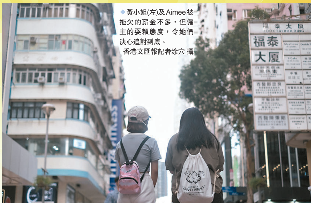
◆黃小姐(左)及Aimee被拖欠的薪金不多，但僱主的耍賴態度，令她們決心追討到底。