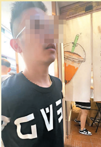
◆香港文匯報記者向黃小姐工作過的奶茶店店長求證。