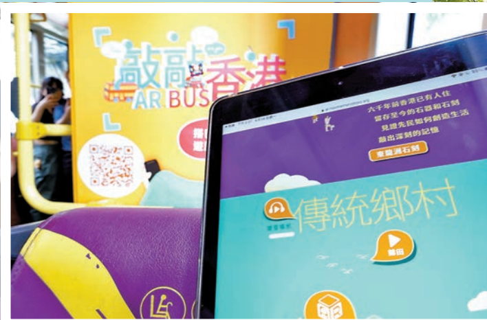
◆掃描巴士椅背附有的QR Code和AR標記，就可以聽商台《18樓C座》中DJ聲音講述古今故事。

最為矚目的AR巴士巡展「敲敲香港·AR BUS」則將目標受眾從學界擴闊至全港公眾，只需掃描巴士椅背附的QR Code和AR標記，就可