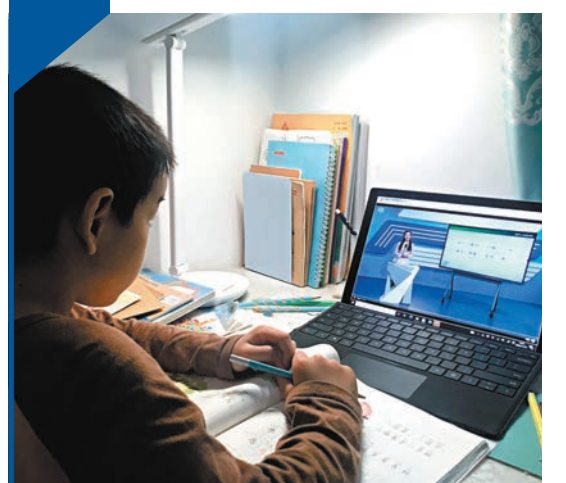
◆《指南》強調，在線教育網絡產品和服務不得插入網絡遊戲鏈接，不得推送廣告等與教學無關的信息。

李小加5月出席一個高峰會時曾指出，滴灌通在內地投資小微企業數量已達到4,000家，行業涉及餐飲、零售、服務等。