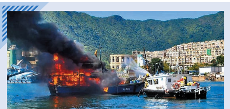
漁船陷火海 昨日下午約2時許，大埔三門仔對開約百米海面，一艘約二十米長漁船擬出海作業時突然發生火警，火勢猛烈，冒出大量濃煙，船上8名船員慌忙棄船跳海逃生。消防輪出動兩隊兩煙囪隊向漁船射水灌救，大火救熄後船艙被燒剩支架。跳海逃生船員全部獲救，無人受傷，由漁農自然護理署的船隻接載上岸。

裁判官表示，控方已證明涉案聚集並非附表的豁免群組，否則各被告無須事先準備標語、橫額、錄音，而部分與防疫完全無關，故裁定涉案聚集並非為傳揚防疫資訊或技巧，以及派發防疫物資，因此不受豁免。控方已毫無合理疑點地證明控罪內容，被告所有傳票罪名成立。