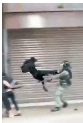
2019年10月13日有片段拍攝到，一名防暴警在旺角雅蘭中心外遭一名暴徒起飛腳襲擊。

上訴庭判詞透露，上訴人於案發前因「管有攻擊性武器」被捕及踢保，有潛在法律程序在身，卻繼續肆意犯案。他及後被改控「串謀暴動」將於今年11月答辯，兩案的案發背景完全一致。縱觀案中所有證據，原審參考持械行劫案例作判刑，是無可批評的，而即使案例不適用於本案，但在衡量相關因素後，判囚7年雖然不短，也絕非明顯過重，故此駁回有關的上訴。