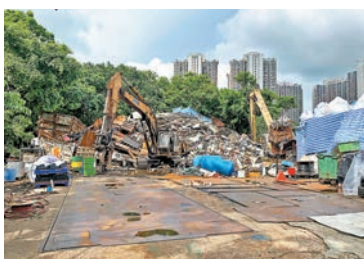
申訴專員主動調查規劃署和地政總署對土地違例發展的執管。

她指出，過去3年，公署接獲30宗相關投訴，顯示公眾對此課題有不少關注，「我決定展開主動調查，審研規劃署和地政總署對土地違例發展的執管，包括兩署跟進違例發展個案的權責和協作，以及現行機制對防止違例發展及處理相關投訴是否適切和有效，以便在有需要時向政府提出改善建議。」市民若有任何資料或意見，可於9月3日或之前以書面方式提交申訴專員公署。