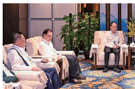
▲代表團拜會海口市委、市領導，雙方進行了座談，期望加強廣泛合作。

7月30日，團員們拜會文昌市委、市政府領導並進行了座談。文昌市委副書記、市長劉冲，文昌市委常委、副市長文傳寶等出席。劉冲表示，一直以來，總會充分彰顯了愛國愛港的使命與擔當，也為文昌輸送了不少創新創業的青年人才，激發文昌發展活力。