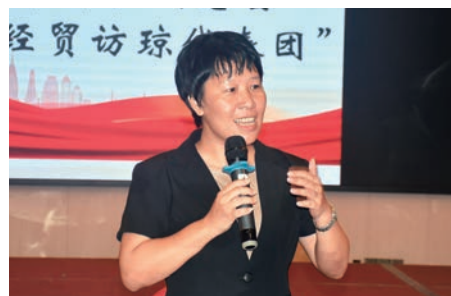
▲萬寧市委副書記、政法書記李姣希望大家多來萬寧體驗沙白海藍的風光。

7月29日，代表團拜會萬寧市委、市政府領導，萬寧市委副書記、政法書記李姣，市委常委、宣傳部部長林靖，市政府副市長沈德安等出席。李姣對訪問團一行表示熱烈歡迎，她表示，萬寧是書法之鄉、檳榔之鄉、武術之鄉，萬寧有109公里的海岸線，有12個海灣，擁有得天獨厚的衝浪資源，希望大家多來萬寧打卡旅遊。