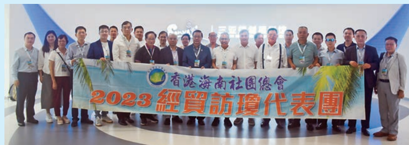
▲團員們參觀三亞市規劃展示館。