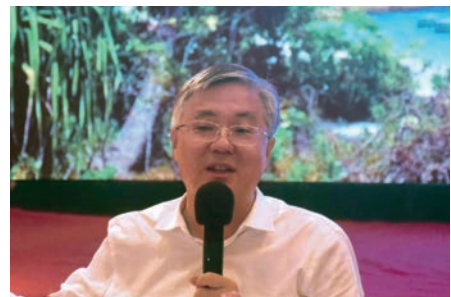
▲海南省委常委、三亞市委書記周紅波希望藉此訪瓊的契機更進一步向香港市民宣傳三亞。

7月28日，團員們拜會三亞市委、市政府領導。出席的領導有海南省委常委、三亞市委書記周紅波，海南省三亞市委常委、統戰部部長潘國華。周紅波熱烈歡迎訪問團一行，對總會長期對香港、家鄉所作出的貢獻給予肯定，希望藉此訪瓊的契機更進一步宣傳三亞、吸引更多人到訪三亞。