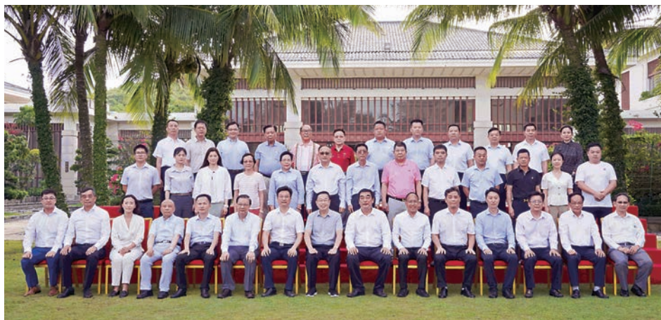
▲團員們在瓊海博鰲國賓館合影留念。