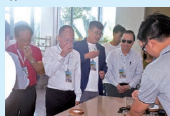
▲團員們在興隆咖啡產業園品嚐咖啡。

首日行程，團員們先來到三亞市規劃展示館，展覽面積約1500平方米，涵蓋「三亞概況」、「規劃展示」兩大內容板塊。館內以打造美麗三亞的「城市會客廳」與「城市規劃交流中心」為目標，展示三亞如何提升城市品質。團員們還參觀了三亞人才之家，三亞着力建設一支與海南自貿港建設相適應、德才兼備的高素质幹部隊伍，為三亞全面深化改革開放各項事業提供保障。