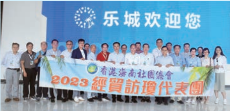
▲團員們在樂城國際醫療旅遊先行區了解樂城最新醫療器材和服務，大家合影留念。

活動的第二天，團員們前往萬寧市，先是參觀了興隆咖啡產業園。在這裏，從儲存區到烘焙區再到包裝區，潔淨明亮的生產車間，全自動咖啡加工設備一覽無遺。團員們繼續前往樂城國際醫療旅遊先行區參觀。借助國家賦予的特許藥械政策，截至目前，樂城已引進臨床急需特許藥械產品324種，基本實現了醫療技術、裝備、藥品與國際先進水準「三同步」。作為全國唯一的「醫療特區」，樂城先行區已成為國內醫療康養旅遊最佳目的地之一。