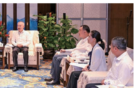
▲代表團拜會海口市委、市領導，雙方進行了座談，期望加強廣泛合作。

7月31日，海口市委副書記、市長丁暉在海口會見經貿訪瓊代表團一行。他說，在自貿港建設持續推進的帶動下，海口政策紅利不斷釋放，外向型經濟發展活力不斷增強。總會作為愛國愛港的重要力量，是海口聯繫旅港鄉親的重要依託。希望總會繼續發揮自身優勢，促成瓊港兩地更廣泛合作。