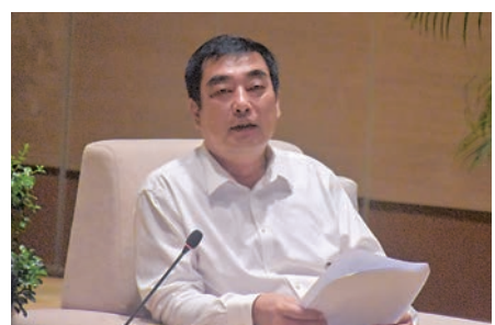
▲瓊海市委書記田志強向長期以來關心支持瓊海發展建設的香港海南社團總會表示誠摯感謝。

7月29日，代表團拜會了瓊海市委、市政府領導。瓊海市委書記田志強、瓊海市人民政府市長傅晟，瓊海市委常委、統戰部部長陳劍華，瓊海市人民政府副市長張笑寒等出席了會面。田志強表示，瓊海正依託博鰲亞洲論壇政商對話平台，對標國際標準，為