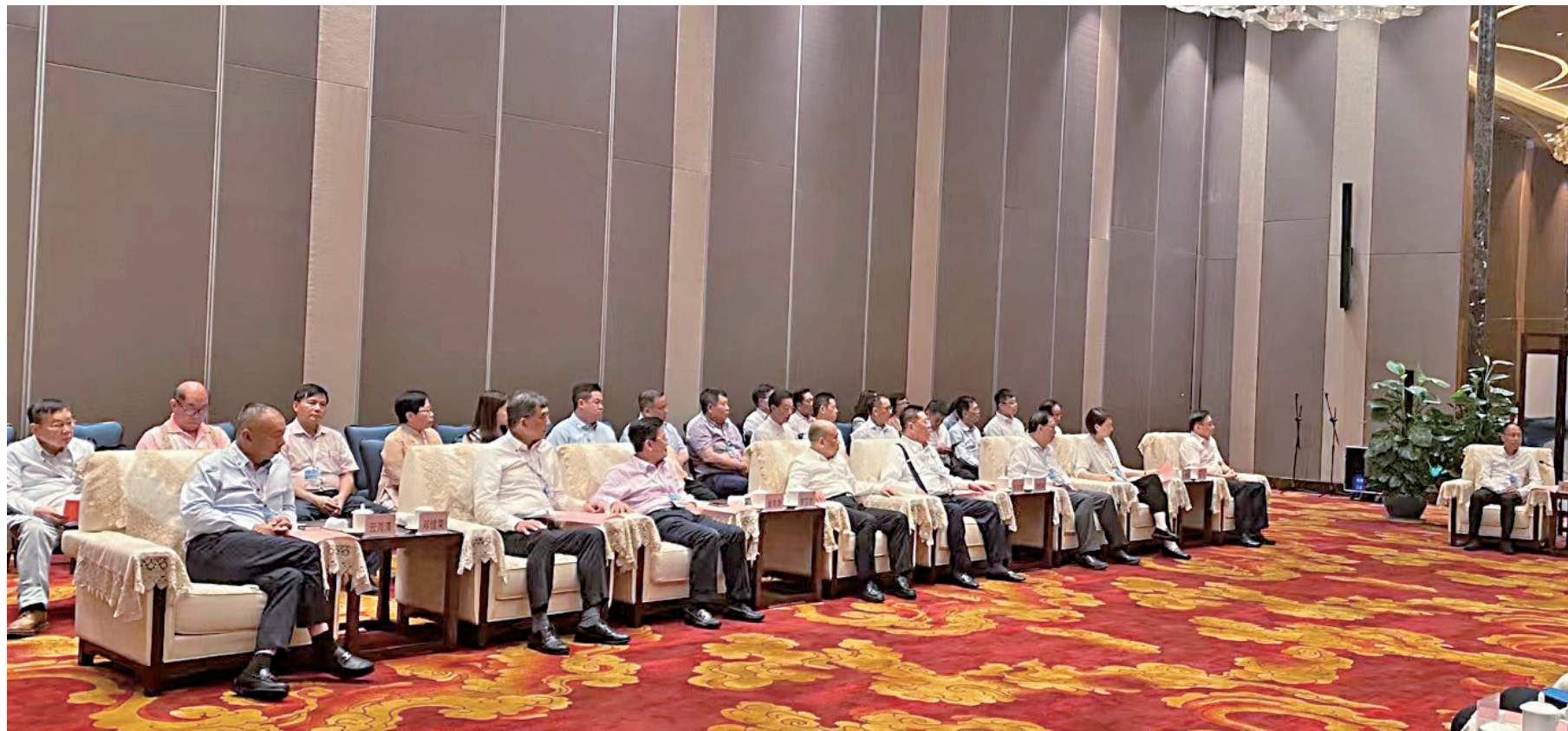
▲香港海南社團總會2023經貿訪瓊代表團拜會海南省委、省政府領導。海南省委書記馮飛，海南省委常委、統戰部部長苗延紅，海南省政府副省長、省委自貿辦主任倪強，海南省政協副主席李國梁，海南省委統戰部常務副部長康拜英等出席了會面。

2022年4月，習近平總書記在海南考察時強調要加快建設具有世界影響力的中國特色自由貿易港。海南省政府抓緊前所未有的歷史機遇，實施一系列開創性舉措，致力讓海南成為新時代中國改革開放的示範和展現中國風範的靚麗名片。為見證自貿港發展歷程以及共享發展機遇，香港海南社團總會（下稱總會）於今年7月28日至31日組織四十人訪瓊，由全國政協委員、總會會長李文俊擔任團長。代表團拜訪了省委、省政府領導，以及參觀海口市、三亞市、文昌市、瓊海市和萬寧市重點項目，了解海南推進對外開放的新進展。