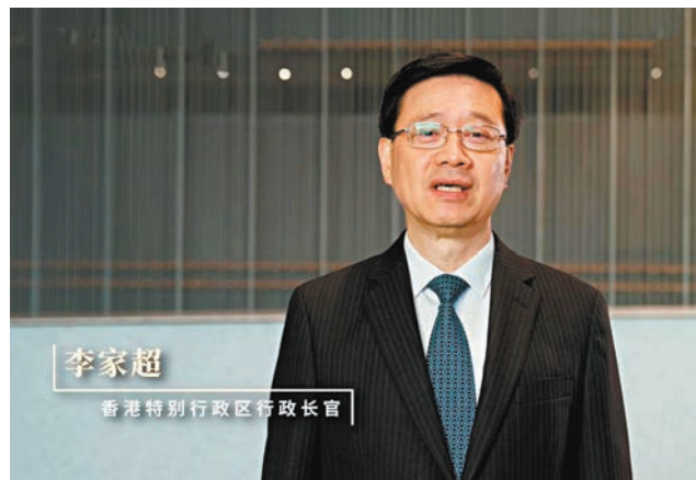
香港特別行政區行政長官李家超為「故宮文創香港空間」送上祝賀。視頻截圖