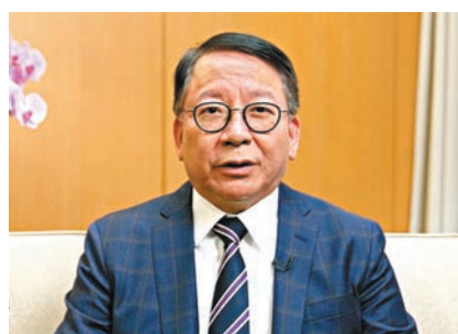
政務司司長陳國基表示香港青年學生走進故宮是別具意義。視頻截圖