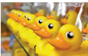
◆B.Duck母企小黃鴨德盈將與沙特PIF共同拓展東南亞及中東市場。