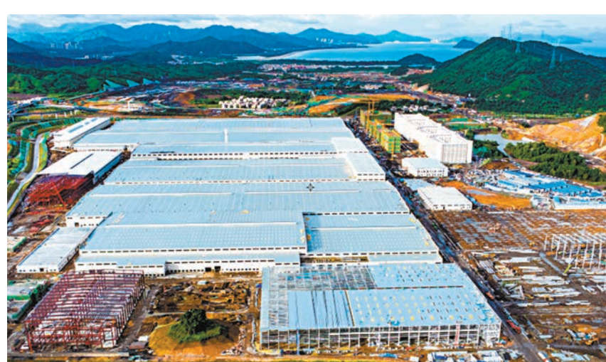
◆深圳市規劃擬2025年新能源汽車產量超200萬輛。圖為在深圳市支持下在深汕合作區比亞迪在建規模龐大的汽車工業園。

《行動計劃》明確提出深圳打造「新一代世界一流汽車城」的一個總體目標，到2025年，全市汽車產量超過200萬輛，年出口量超過60萬輛；打造萬億級汽車產業集群，產業核心競爭力不斷提升，汽車技術水平、場景應用和產業規模位居全國前列；構建囊括整車、動力電池、電機電控、自動駕駛、智能座艙等完整產業鏈；到2025年，新能源汽車保有量達到130萬輛，新能源汽車新車市場滲透率達到70%，位居全國前列。建成充電樁60萬個、超級充電站300座、推進綜合能源補充體系建設。以國際級聯盟、會展、賽事為媒介，提升汽車產業國際化發展水平。