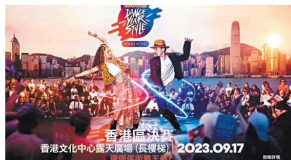
Red Bull Dance Your Style將於9月17日假香港文化中心露天廣場舉行。