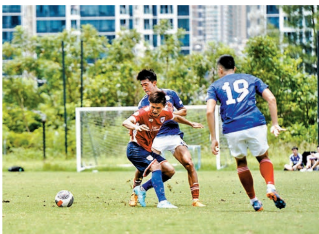
香港U23(紅衫)在季前熱身賽，以0：5不敵東方。

香港文匯報訊(實習記者 徐梓鋒)東方足球隊昨日與香港U23在將軍澳訓練中心進行了一場季前熱身賽，U23面對傳統勁旅東方顯得力不從心，被東方以5：0輕鬆取勝，其中東方3名新兵均有上陣。U23教練司徒文俊雖然對此賽果感到不滿，認為球隊表現不佳，但仍表示理解球會現在的困境。