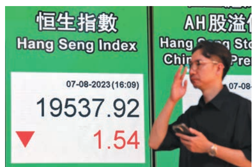
◆恒指昨日僅跌0.01%。 中通社

個股方面，有消息指近日內地醫藥領域腐敗問題集中整治全面啟動，昨日多隻醫藥股下跌。其中，翰森製藥(3692)收報10.24港元，大跌10.02%，是昨日表現最差的藍籌股。