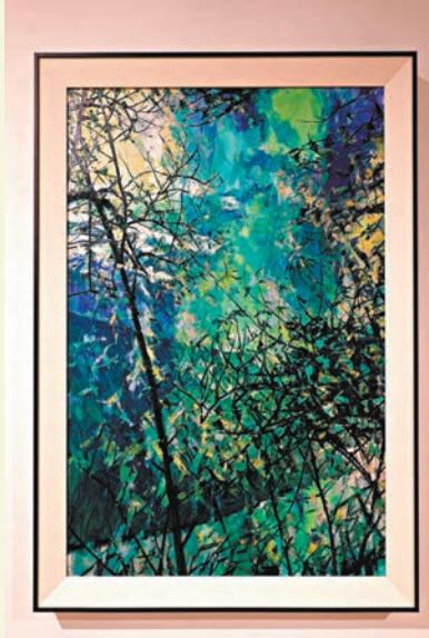
◆《富春山旅圖之三·有鳳南來》