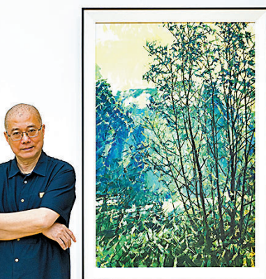
◆許江的新作品既有江南特色，亦延續了葵園系列的滄桑。圖片由當代唐人藝術中心提供