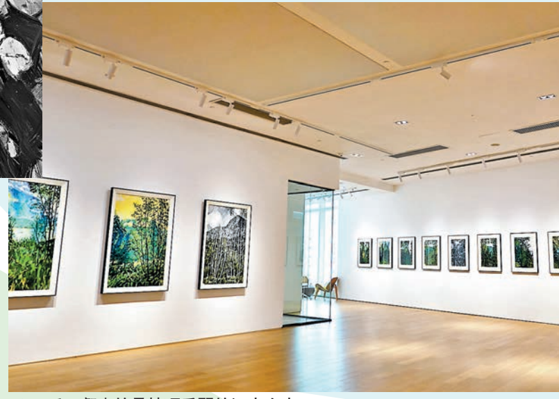
◆一丘一壑畫的是精巧秀麗的江南山水。

熟悉許江的人大概都對他的葵園不陌生，二十多年來，他一如既往地迷戀葵的風姿，琢磨各種葵的形態，春葵、秋葵、老葵、碩葵、殘葵、雪葵……「這兩年，我的心境越來越平靜，我開始回歸山林，在那之中找到獨特的意趣。」許江說。