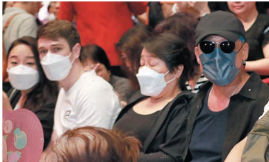
◆梁家輝與家人現身力撐。

地巡演,現在是做一場少一場了,阿B稱今次是與粉絲分享成果,溫拿不再是Rock騷,不會像小鮮肉般跳來跳去,粉絲的欣賞角度亦不同了;阿倫又笑指溫拿現在已是罐頭肉和午餐肉。