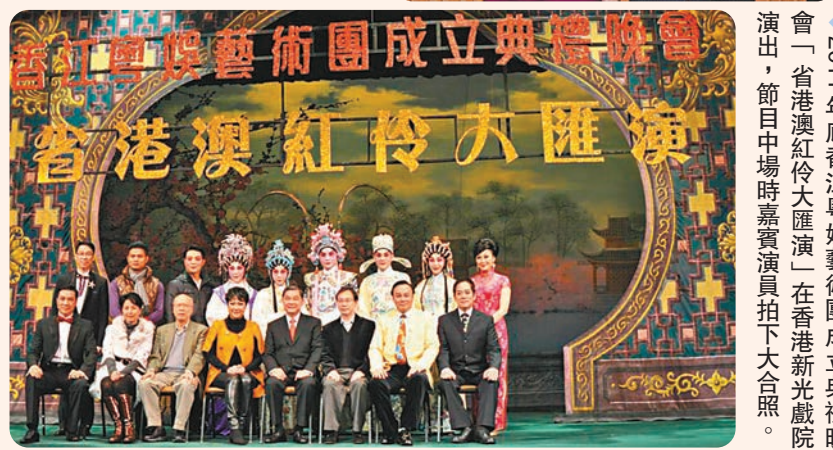
◆2011年底香港江門粵劇藝術團成立典禮晚會「省港澳紅伶大匯演」在香港新光戲院演出，節目中場時嘉賓演員拍大合照。