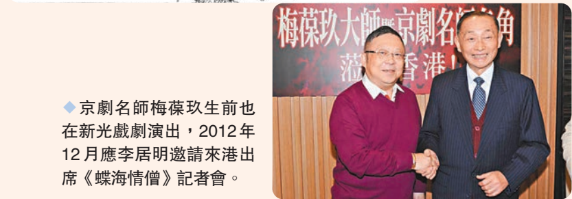
◆京劇名師梅葆玖生前也在新光戲院演出，2012年12月應李居明邀請來港出席《蝶海情僧》記者會。