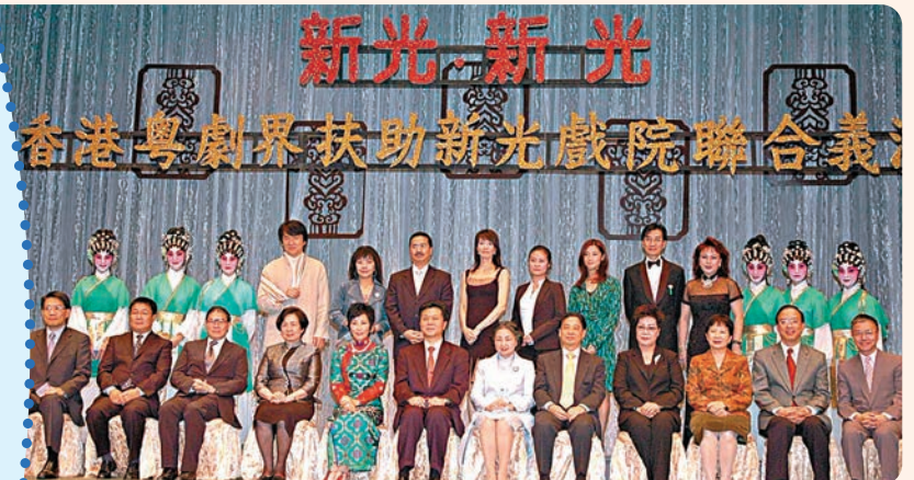
◆2009年1月演藝界曾為扶助新光戲院義演「新光·新光香港粵劇界扶助新光戲院聯合義演」。