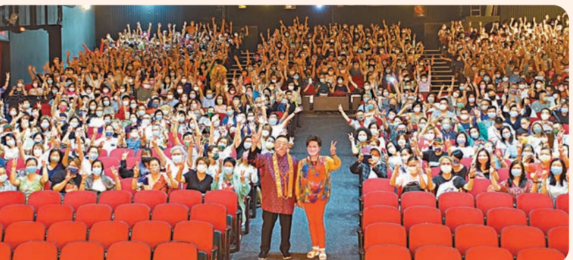
◆疫情期間仍有不少粉絲到新光劇場睇戲支持粵劇。

香港文匯報訊（實習記者 趙雨竹）1972年，新光戲院成立，位於香港北角英皇道僑輝大廈，前身為商務印書館印刷廠香港分廠。由「華昌企業有限公司」委託「銀都娛樂有限公司」經營管理。有「香港粵劇殿堂」和「睇大戲，去新光」的美譽。劇場設有1院及2院，分別包含1,033位座席和108位座席。第一套上映的電影是《文化大革命期出土文物》。1980年9月1日起，轉為「新光娛樂有限公司」經營。1980年代起，很多粵劇名伶如任劍輝、紅線女和林家聲等，都曾在新光戲院演出。1984年，粵劇紅伶新馬師同有「活曹操」之稱的京劇名家袁世海合演《華容道》，分飾關羽和曹操。1988年8月，「香港聯藝機構有限公司」接管經營。2005年，業主以租約為由，想將戲院發展為主題商場。女演員汪明荃代表香港粵劇界進行交涉，加上政府的介入，才得以續租至2009年。其後再續租3年，租金增至近70萬元。2011年，被譽為「粵劇白武士」的國際著名堪輿學家李居明先生為推動粵劇文化，成立「盛世天戲劇團」。一年多內，創作了《蝶海情僧》、《金玉觀世音》、《聊齋驚夢》、《俏孔明》等戲。2012年2月18日，李先生以月租一百萬元的價格租下新光戲院，繼續以這個粵劇殿堂發揚粵劇並推動本土文化。2012年5月21日，新光戲院重新投入使用，並改名為「新光戲院大劇場」。2023年8月9日，新光業主羅守輝公開透過地產代理將物業推出市場放售。「新光戲院」又將面臨清拆，最快會是2026年。若重建，要2032年才可完成，將來會保留三間戲院。