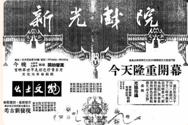
▲1972年新光戲院開幕廣告。