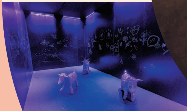
◆ 在夜光畫室裏可使用會場的夜光顏料於牆上繪畫。