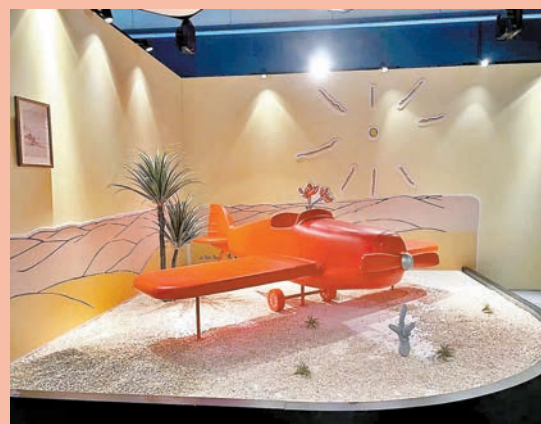
◆ 一架立體飛機停在飛行員與小王子相遇的沙漠。