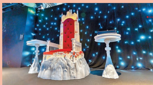
◆ 拜訪六個星球之國王的星球。

小王子×六位香港藝術家，重新創作演繹「奇怪」新意象。在無邊的星空中，一起深度拜訪六個由香港著名藝術家創作的星球，探索大人活在一人國度中的「奇奇怪怪」，除充滿創意和寓意的IG-able立體場景外，主題區更是展出了藝術家的手稿。