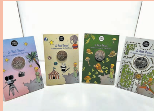
◆ 多款不同年代的《小王子》收藏品。

《小王子》陪伴我們成長，其魅力與不同人身處不同階段時的閱讀有關。進場前，1.7米高的超吸睛3D小王子和B612星球、狐狸和玫瑰已在門口歡迎你。展覽特設5大劇場式主題展區，讓大小朋友從不同角度重新細味故事情節、富有詩意的插圖、經典語錄和哲理。