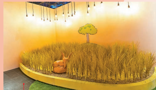
◆ 狐狸躺在麥田玫瑰園。