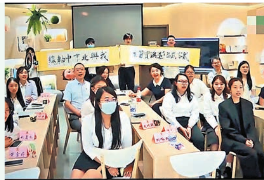
◆ 成果分享會(上)，慶功宴(下)

我與同學們在北京中軸線的緣分下相遇，亦師亦友地共同奮戰了一個月，十分期待和他們在港澳繼續傳播北京中軸線及向聯合國申遺的相關知識，讓更多人關注和參與此國家大事。