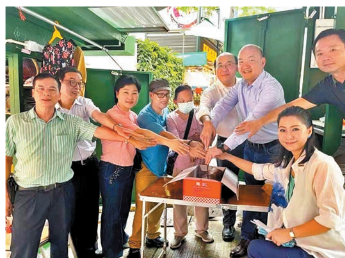
各界一同協助早前被貨車撞毀的中環排檔復業。

周文鴻強調，作為立法會議員，不分界別都非常關心社區事務，急市民所急，這是理所當然。今次排檔復業，期望能吸引更多市民多點光顧，讓兩位老人家的排檔生意重回正軌，過好日子。