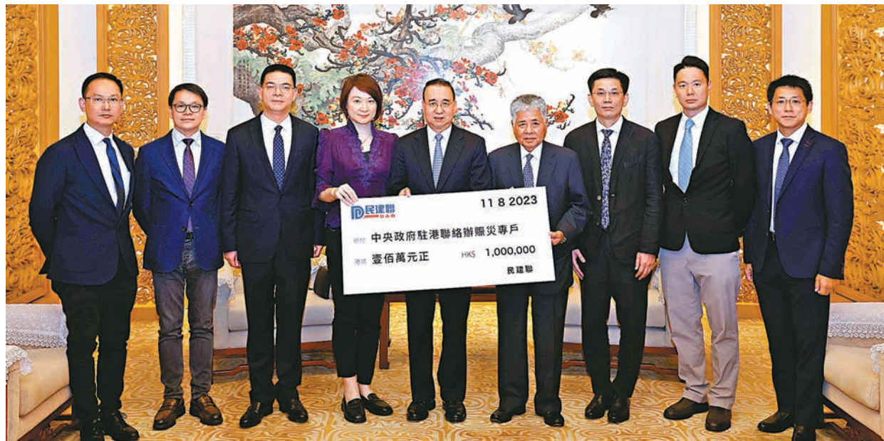
香港各界人士和團體積極捐款支援內地防汛賑災，其中民建聯捐款100萬港元（左圖），自由黨捐款50萬港元（右圖）。