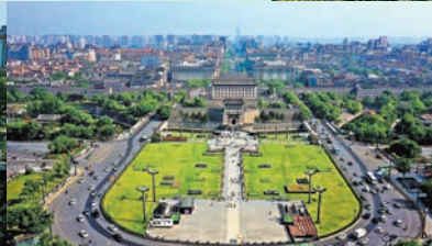
◆ 西安城牆景區永寧門文化廣場