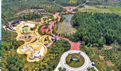
◆ 滄州大運河生態修復展示區