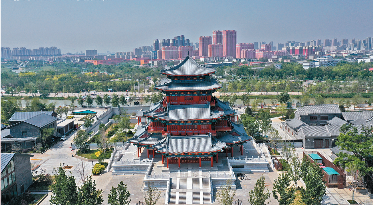
◆ 滄州市京杭大運河河畔的南川樓