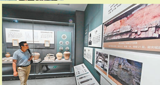
◆ 遊客在治山春秋園內的治山遺址博物館參觀。