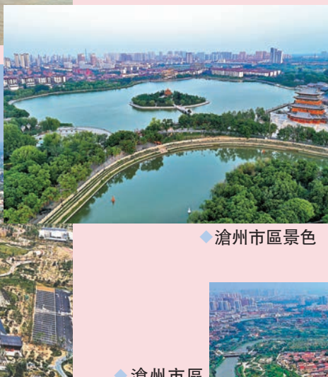
◆ 滄州市區境內的京杭大運河河道