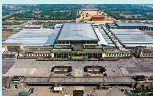
◆ 西安火車站與大明宮國家遺址公園