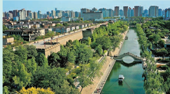
◆ 西安城牆西側護城河