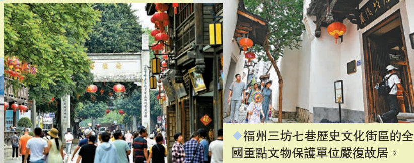
◆ 福州三坊七巷歷史文化街區的全國重點文物保護單位嚴復故居。