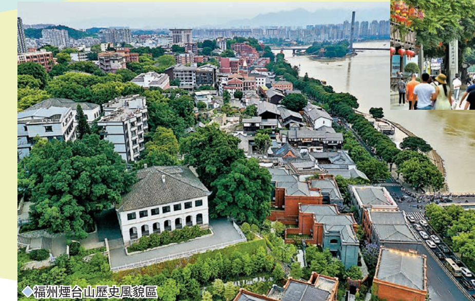
◆ 福州烟台山歷史風貌區