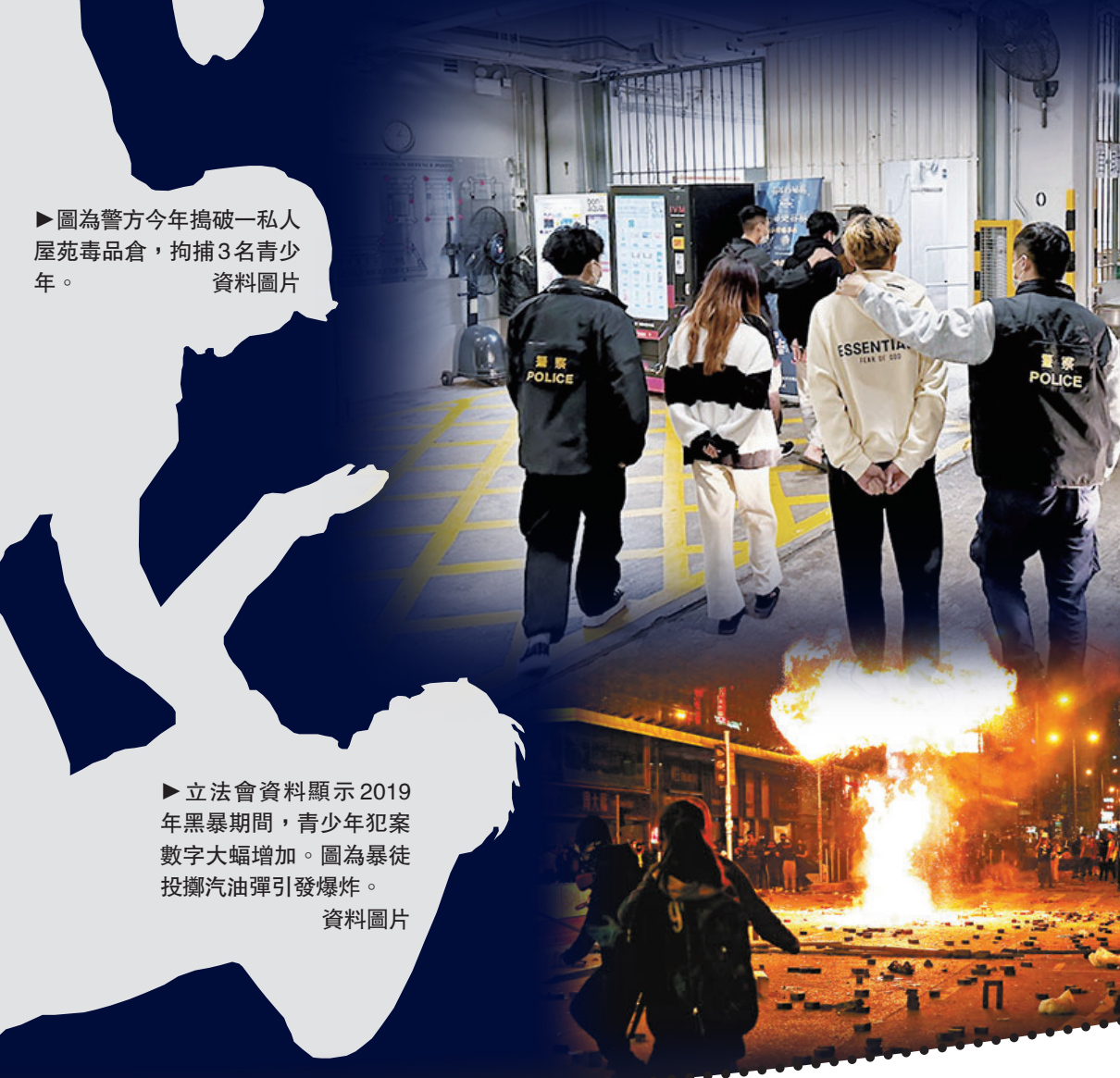
立法會資料顯示2019年黑暴期間，青少年犯案數字大增加。圖為暴徒投擲汽油彈引發爆炸。