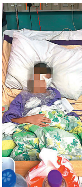
◆穆斯林男童視網膜脫落，需要接受手術，目前仍在留醫。 資料圖片

香港文匯報訊 一名13歲穆斯林男童日前在穆斯林學校上課期間，疑因未能背誦《可蘭經》其中一節經文，被老師多次掌摑，導致視網膜脫落，需要接受手術，目前仍在留醫。涉事男童的胞姊昨日接受電台節目訪問時透露，與其胞弟同班的學生亦曾被老師掌摑，但因為憂慮外界會對伊斯蘭教產生誤解，希望男童家人不要報警。