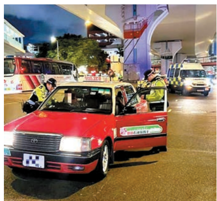
◆警員在港島區截停一輛涉嫌違例的士調查。

西九龍總區交通部聯同油尖警區人員自前日(11日)開始在尖沙咀區打擊「黑的」。前晚，警員喬裝乘客在廣東道乘搭的士前往一些熱門旅遊景點，兩名分別32歲及55歲的的士司機涉嫌濫收車資，索取高於合理車資的費用，被警員當場拘捕，現獲准保釋候查，須於9月上旬向警方報到。警方又向其他違例的士司機發出共41張傳票及罰款通知書。