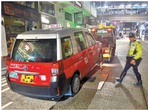
◆警方將一輛不適宜在道路上行駛的士拖走檢驗。