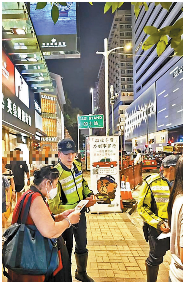
◆警員在尖沙咀遊客區派發傳單，提醒市民及遊客遇濫收車資的的士司機時要舉報。

為提升的士的服務和形象，特區政府早前提出一系列建議措施，包括引入的士車隊制度、嚴懲違法的士司機、針對違法司機的扣分制等，包含相關建議的條例草案已於上月中旬在立法會進行首讀和二讀，相關法案委員會本月已進行第一次會議，下次會議將於9月初進行，政府會全力配合法案委員會的工作，希望早日實施新措施，令的士服務更健康发展。