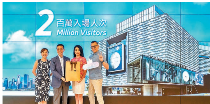
◆楊潤雄(左二)及莫家詠(左一)歡迎第二百萬名訪客並送上特別的紀念品。

交通規劃。出席論壇的香港特區政府運輸及物流局局長林世雄論壇後向傳媒表示，在聽取民建聯和居民的聲音後，政府會在「多元組合」的基礎上，研究有否空間提高啟德整體交通系統的持續性和暢達性等。