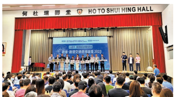
◆民建聯邀請當區居民及政府代表等份份者暢所欲言，集思廣益，解決啟德交通擁堵問題。

對各界有呼聲要求政府建設單軌電車等集體運輸系統，接駁郵輪碼頭，他表示長遠會作考慮，但需要計算成本效益。