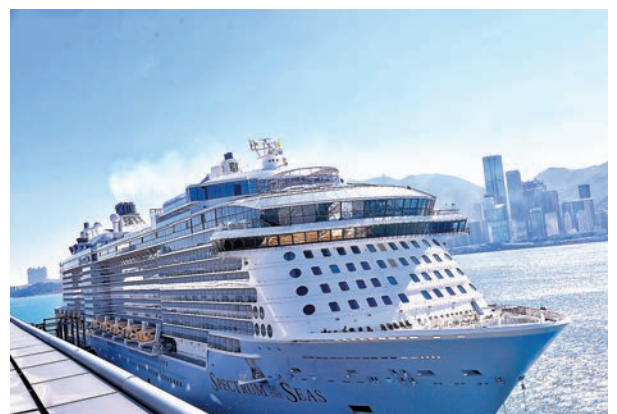
◆「海洋光譜號」將於本周六再次來港，將考驗啟德郵輪碼頭的接待力。圖為「海洋光譜號」。資料圖片

香港文匯報訊(記者 文森)超級郵輪「海洋光譜號」將於周六(19日)再次來港，約五千名旅客將考驗啟德郵輪碼頭的接待力。香港特區政府文化體育及旅遊局局長楊潤雄昨日接受電台訪問時表示，將汲取經驗做足接待準備，包括預先了解旅客行程安排、安排更多巴士和的士迎接，以及分批安排旅客下船等，務求為旅客提供更佳旅遊體驗。未來，政府會重新檢視碼頭的定位。