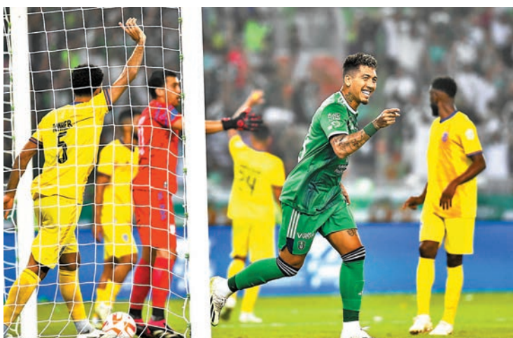
◆法明奴(綠衫)個人連中三元。