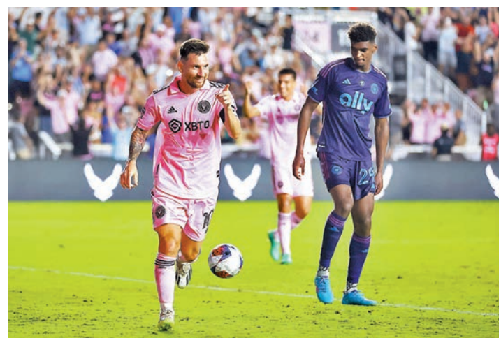
◆美斯(左)完場前取得入球。

另一方面，在今夏積極招買買馬的沙特阿拉伯聯賽，亦於香港時間周六凌晨開鑼，結果有車路士門將艾杜亞文迪、利物浦前鋒羅拔圖法明奴、曼城翼鋒馬列斯、紐卡素翼鋒辛特麥斯明、巴塞隆納中場卡斯及羅馬中堅伊賓尼斯加盟的吉達艾阿里，以3:1擊敗艾哈森；吉達艾阿里的所有入球均由法明奴包辦，成功上演「帽子戲法」。