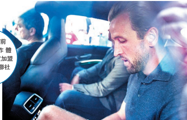
◆卡尼日前抵達德國作體測，並已官宣加盟拜仁。

周日另一場英超比賽為賓福特主場對熱刺(now621台今晚9:00p.m.直播)。賓福特有上季正選門將拉耶希望離隊，這位西班牙球員將和長期停賽的上季首席前鋒東尼一同缺陣，為了作替補，賓福特已向弗賴堡先後買入門將費利根及前鋒舒哈迪，且看兩位在上季德甲表現出色的球員，能否立即適應英超節奏。至於熱刺今晚亦肯定不會有哈利卡尼壓陣，這位英格蘭國腳昨日已官宣加盟拜仁慕尼黑，並於昨午在社交平台發短片與熱刺球迷告別，故熱刺今晚只能依靠孫興民及李察利臣爭取勝利。