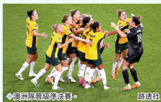
◆澳洲隊晉級準決賽。

女足世界盃周六上演兩場比賽，其中東道主澳洲隊120分鐘與法國隊踢成0:0，互射12碼以7:6勝出晉級。至於英格蘭隊較後時間則以2:1淘汰哥倫比亞隊，將於周三與澳洲隊爭入決賽。◆綜合外電