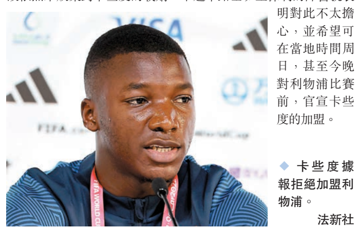
◆卡些度據報拒絕加盟利物浦。

在這情況下，利物浦一方自然十分不滿，但據最新消息指，車路士高層已經立即出手與白禮頓高層會面，據報他們將出價1.14億英鎊，而給予卡些度的周薪亦較利物浦多1倍，達到25萬英鎊周薪。然而，有指利物浦陣營對車路士如何能在不違反歐洲足協的FFP(財政公平競賽原則)下，再花費過億英鎊買人感到不解，故依然未放棄對卡些度的收購，不過車路士班主保利的陣營就表明對此不太擔心，並希望可在當地時間周日，甚至今晚對利物浦比賽前，官宣卡些度的加盟。