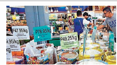
全球米價恐持續上漲。圖為菲律賓民眾在街市買米。