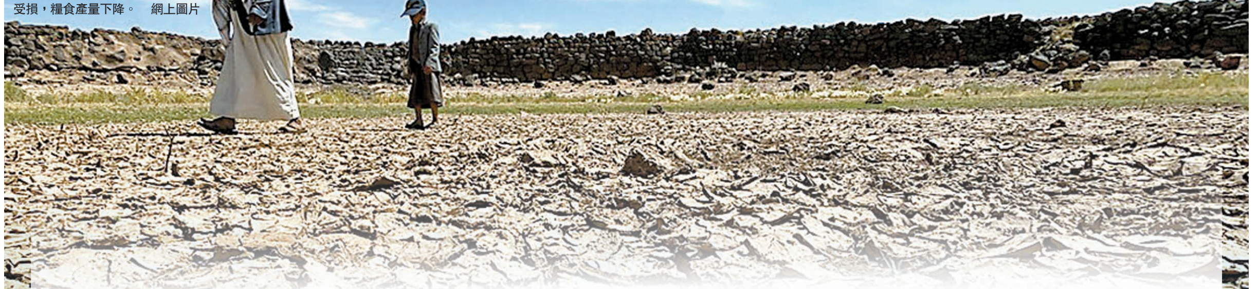
全球多地荒漠化嚴重，土壤質素受損，糧食產量下降。

香港文匯報訊 全球變暖導致氣溫不斷上升，極端天氣更為頻繁，亦衝擊糧食生產及供應。聯合國防治荒漠化公約會議主席日前警告，在全球氣溫升幅超過工業革命前攝氏1.5度之前，各國就可能面臨糧食供應嚴重中斷問題。氣候危機的衝擊以及水資源短缺、土壤荒漠化、不良耕種方式等問題，都會威脅全球農業發展。