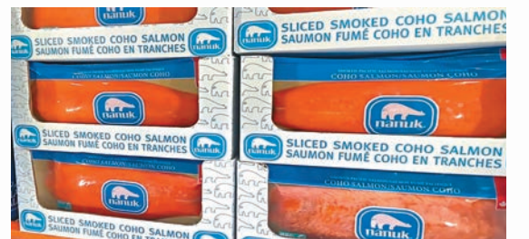
加拿大盛產三文魚，氣候變化奪去商機。

釀酒師兼葡萄栽培師平特表示要在高溫下釀酒非常艱難，所以這個行業需要就氣候極端轉變，對酒莊進行大規模調整。平特已經轉為在夜間灌溉農地，務能盡量減少蒸發，並從高架灌溉改為滴灌以節約用水、調整生長季節及更嚴格測試土壤。卑詩省葡萄酒種植商協會預計今年葡萄酒和葡萄產量，將會下降39%至56%。