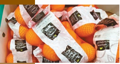
美國柳橙產量減少四分之一，加拿大和歐盟從別國輸入。

美國農業部估計全國今年柳橙產量將下降超過四分之一至230萬噸，總產量跌至56年來最低水平。農業部發言人表示，柑橘黃龍病導致果實掉落，加上產地面積減少和颶風襲擊，政府預料佛州的柳橙產量將持續下降，拖累橙汁產量預計減少近50%，降至8.5萬噸的歷史新低點。美國現在幾乎不能輸出橙汁，只能勉強應付國內需求。不過，橙汁並非生活必需品，漲價太高可能令消費者望而卻步。美國統計局數據顯示，美國非冷凍、非碳酸類果汁和其他飲品過去1年的價格上升3.2%。