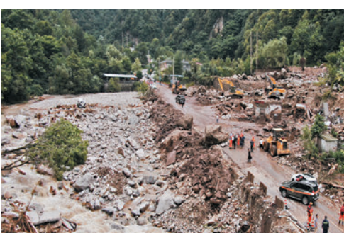
◆12日拍攝的西安市長安區灤鎮街道喂子坪村雞窩子組山洪泥石流災害現場。

8月11日山洪泥石流災害發生後，西安市立即成立現場指揮部，組織消防、公安等14支救援力量共計980餘人，投入生命探測儀、衛星電話、挖掘機等1,100餘台（套）設備和搜救犬、爭分奪秒做好人員搜救及搶險救援等工作。截至13日18時，災害共造成21人遇難，6人失聯，2戶民房（約300平方米）損毀，當