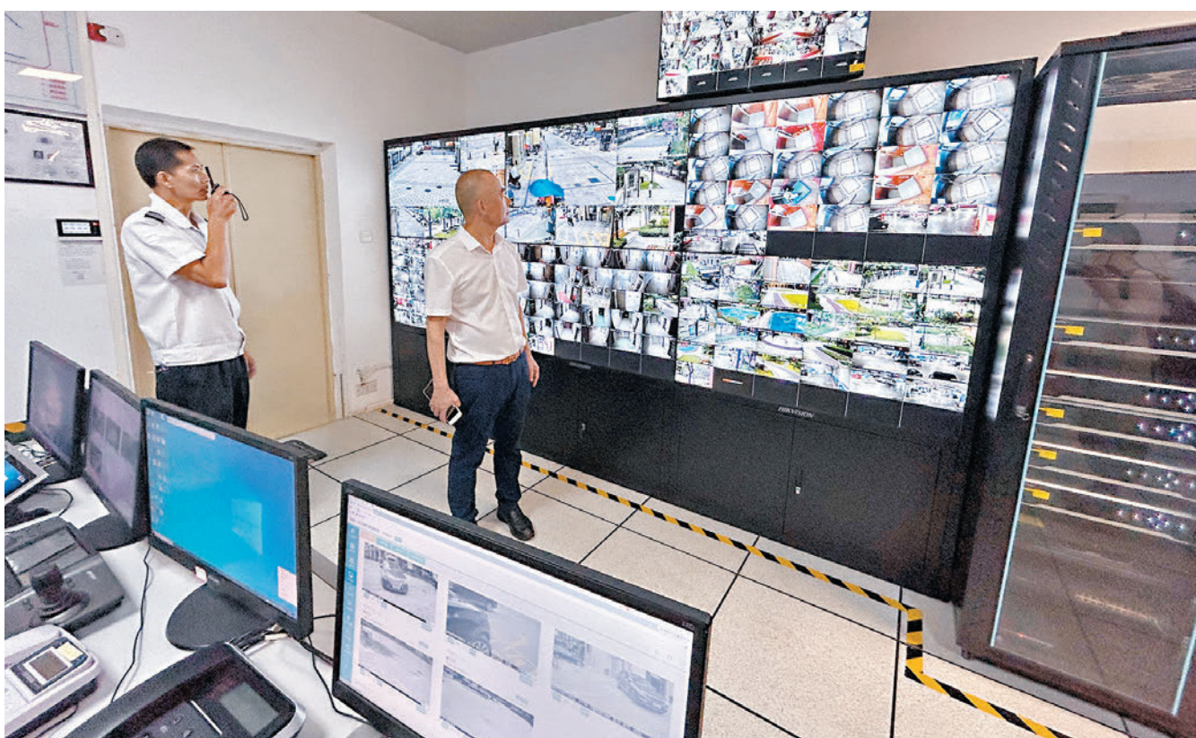
◆興兆物業在佛山花曼麗舍小區的後台視頻監控設施。

「大灣區建設給粵港物業管理交流與合作提供了契機，兩地服務融合正在加速推進。此次物業管理協會成立後，禪城區將推動當地與香港業界雙向交流，促進大灣區物業管理高質量發展。」佛山市禪城區住建局相關負責人說。