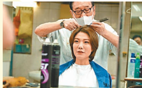
◆龍婷親身落場一試師傅手藝。

香港文匯報訊 香港文化博物館為紀念一代巨星張國榮逝世20周年舉辦的「繼續寵愛·張國榮紀念展」，昨日迎來第30萬名參觀者。博物館特為第30萬名觀眾送上3位首席策展人張叔平、夏永康和陳淑芬簽名的展覽海報、香港電影資料館「芳華再續」專題放映活動免費電影門票、張國榮20周年復古玫瑰紀念章，以及「瞧潮香港60+」禮物包。第30萬名參觀者是李先生一家，兩夫婦都很喜歡聽張國榮的歌曲，他們認為張國榮是香港人的集體回憶，也很高興能在展覽中見到張國榮的舞台服裝。 同時，因9月12日是張國榮67歲冥壽，原定星期二休館的香港文化博物館將特別開放，當日，博物館一樓劇院會免費放映兩套張國榮主演的經典電影，分別於上午11時放映《戀戰沖繩》及下午3時放映《東邪西毒》。活動開始前15分鐘入場。名額有限，先到先得，額滿即止。