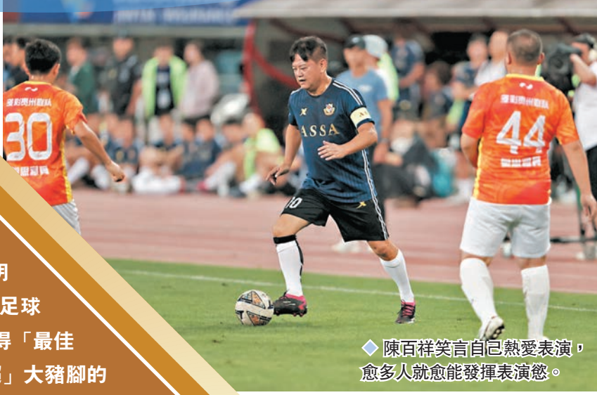
◆陳百祥笑言自己熱愛表演，愈多人就愈能發揮表演慾。