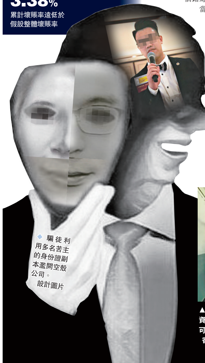
◆ 騙徒利用多名苦主的身分證副本濫開空殼公司。 設計圖片

事後，李先生同樣無法聯絡KK，至於他投資的工廈項目，月前他從另一名股東口中得知項目早已賤售分錢，李先生卻蒙在鼓裏，他分得的款項更由KK代收，之後一去無回頭，李先生遂於今年7月21日到地庫警署報案求助，惟他打定輸數。今次騙局，他既損失投資工廈的資金，又預上5,000萬元巨債，損失慘重。