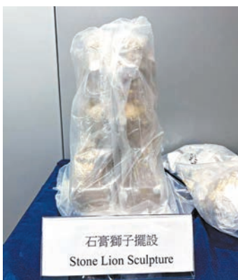
檢獲的海洛英藏於石膏獅子雕像內。

香港文匯報訊(記者 蕭景源)警方早前發現有販毒集團用石膏獅子雕像掩藏海洛英，由泰國運來港，香港和泰國緝毒部門情報交流後聯手採取行動，兩名被招攬到泰國寄毒郵件的港女在曼谷被捕，香港警方則拘捕兩名男同黨，並檢獲共11.9公斤海洛英及387克霹靂可卡因，市值約1,200萬港元。在港被捕的兩名男子，被控一項「販運危險藥物」罪，今日於屯門裁判法院提堂。