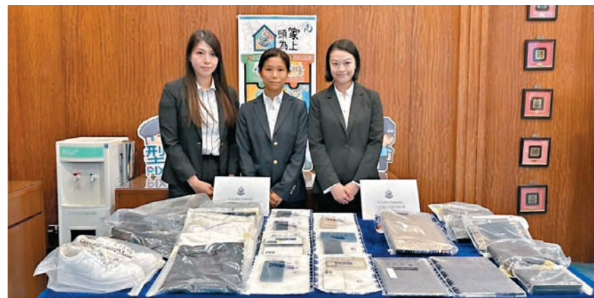
警方偵破一個詐騙集團，涉嫌訛稱電訊公司積分到期或提醒換領禮品，盜取信用卡資料在網購平台落單購物等，昨日展示行動中檢獲的證物。