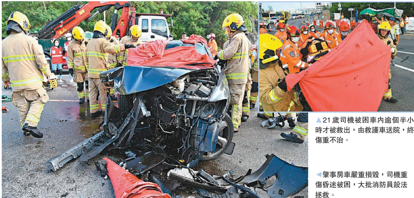
21歲司機被困車內逾個半小時才被救出，由救護車送院，終傷重不治。