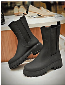
◆品牌新推水靴系列

香港鞋履品牌 The Korner 以舒適穿著體驗及時尚外表設計，專注為女性生活中的不同場合度身訂做最貼心的鞋履。今個8月，品牌新店以嶄新面貌登陸圍方 The Wai，全新開設的門市空間闊落，環境明亮淡雅，為大家帶來放鬆自在的購物體驗。品牌更全新推出四款法式小心機女裝鞋款，引領「Effortless Chic」潮流，打造出優雅隨性的風格，讓你在低調中盡顯迷人女性魅力。同時，新店內亦展示了品牌一系列百搭時尚的最新鞋款，為你提供穿搭靈感，輕鬆襯出氣質滿分又百變的造型。全新推出的法式迷人鞋履，舒適自在的設計配以氣質優雅的細節，如Kassel Buckle Loafers的鞋型採用時下流行的圓頭平底設計，既舒適又大方得體，配以雙倍鞋墊，皮革柔軟光滑，穿在腳上舒適自在，打造出別具特色的率性感。