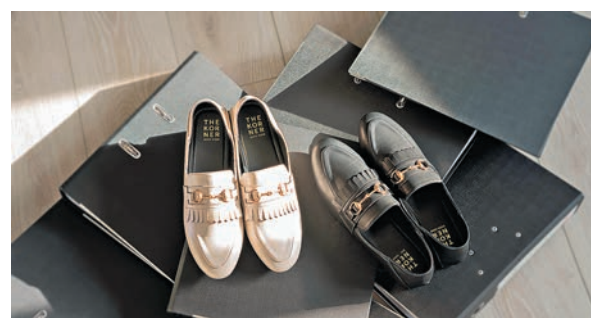
◆Kassel Buckle Loafers 系列