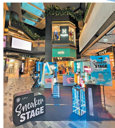
◆C.P.U. Sneaker Stage 期間限定展覽