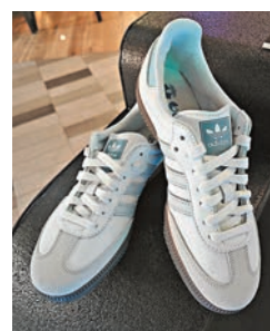
◆adidas Samba OG