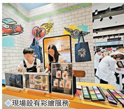
◆現場設有彩繪服務

自1851年起，Kiehl's在美國紐約曼克頓開始致力照顧各種肌膚所需，從世界各地搜尋優質的天然成分，研發了一系列面部、頭髮及身體保養品。由即日起至8月20日，品牌以真實比例的裝潢將New York Subway帶到尖沙咀海港城，讓大家可以乘坐品牌紐約地下鐵，並一起探索172年品牌傳統及皇牌產品，體驗品牌的紐約精神和暢遊紐約打卡熱點！今次活動品牌以美國鐵路特色為靈感，將紐約地下鐵搬到海港城海運大廈入口大堂，打造「Kiehl's New York Subway」期間限定店，場內除了設有多個充滿紐約街頭藝術的打卡位，更有品牌豐富獨家精美禮品讓大家帶走。當中，作為品牌的代表Mr. Bones，它會在車廂內與粉絲們合照。接着，大