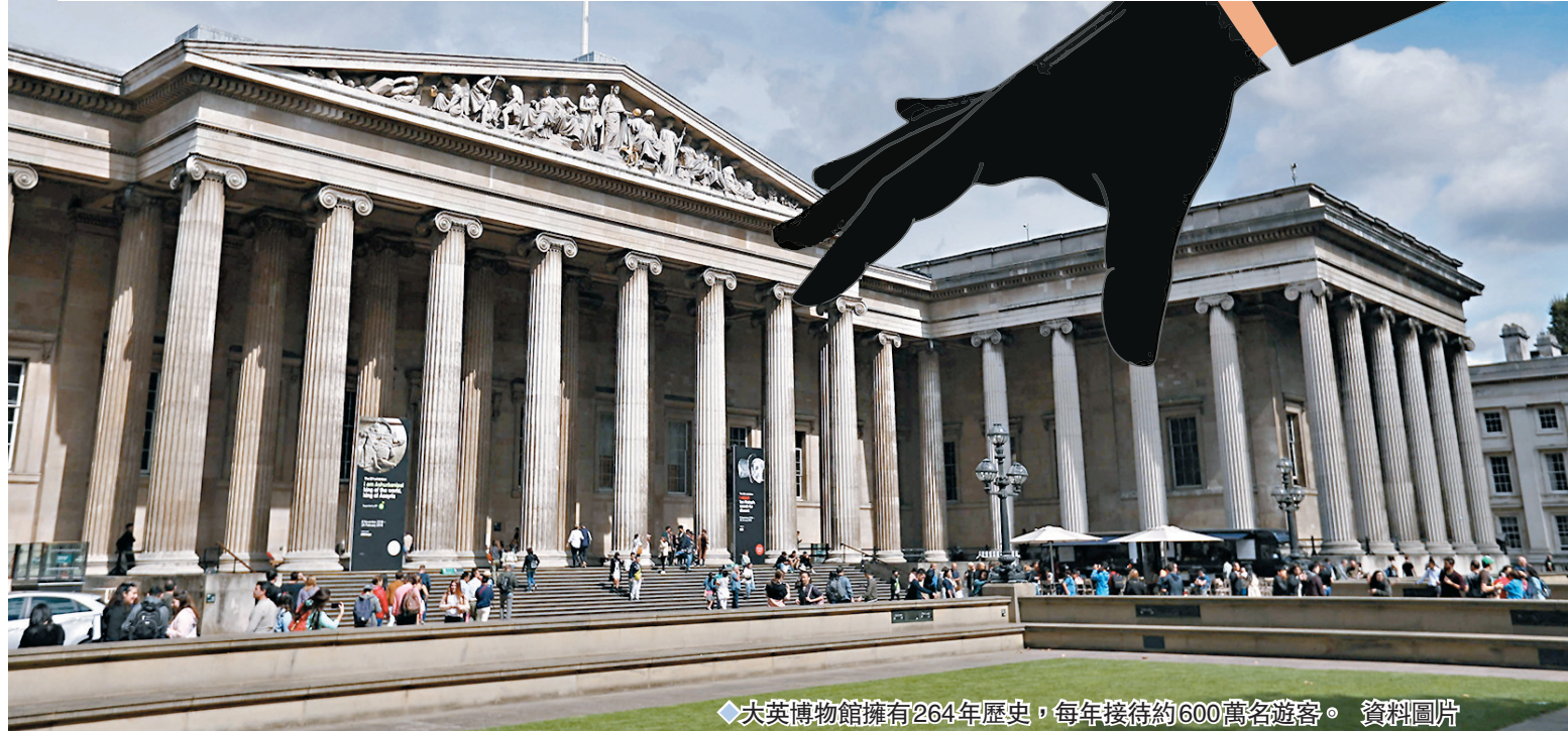
大英博物館擁有264年歷史，每年接待約600萬名遊客。資料圖片