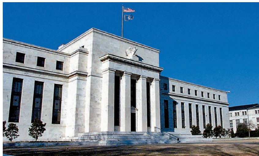
◆鑑於勞動力市場仍然緊張，加上能源和食品價格一度攀升，聯儲局仍有理由維持審慎。

雖然聯儲局或會樂見此趨勢，但美國經濟數據維持穩健令投資者憂慮出現通脹停滯或升至更高水平。鑑於勞動力市場仍然緊張，服務業強勁，消費者擁有超額儲蓄，以及能源和食品價格一度攀升，聯儲局仍有理由維持審慎。投資者和聯儲局將密切留意趨勢變化，如果經濟維持上行，住房通