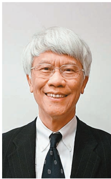
◆彭博消息指，任志剛準備在港交所現任主席史美倫任期於明年4月結束後接替她擔任主席。