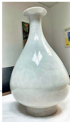
◆明代永樂年間的花瓶在2019年失竊。

目前該隻明成化鬥彩雞缸杯仍下落不明,英國警方正懸賞1萬英鎊(約10萬港元)徵求線索。