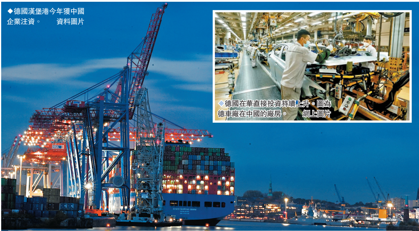
◆德國漢堡港今年獲中國企業注資。資料圖片

根據德國聯邦外貿與投資署發布的報告,截至2022年底,中國連續7年成為德國全球最大貿易夥伴。在今年第一季度,德國對華投資高速增長,中國商務部新聞發言人束玉婷表示,今年1至3月,部分國家和地區對華投資較快增長,其中德國來華投資增長了60.8%。