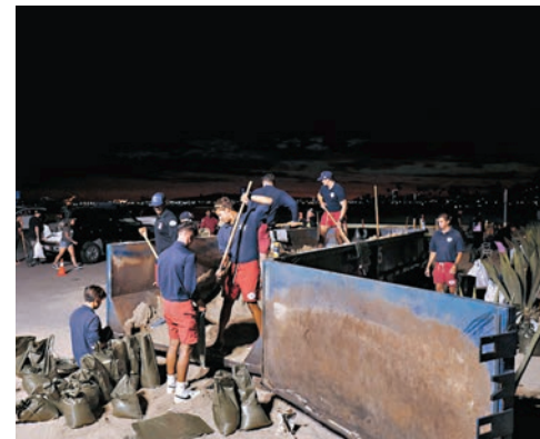
◆洛杉磯長灘救災生員和消防員在沿岸堆放沙包。

中國駐洛杉磯總領館發布緊急提醒,表示預計颶風將為南加州和亞利桑那州部分地區帶來強風、強降水、洪水、泥石流等災害,中國公民需密切關注當地氣象預報和天氣變化,作好應對準備,嚴格遵從當地政府發布的災害信息和撤離指引,遠離山區、河道或地勢低窪等高风险地區。