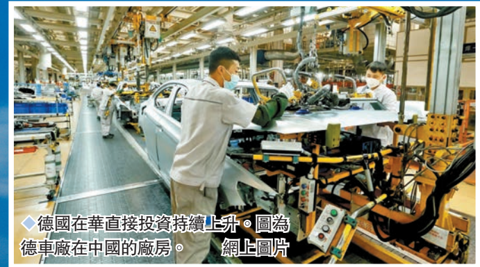
◆德國在華直接投資持續上升。圖為德車廠在中國的廠房。