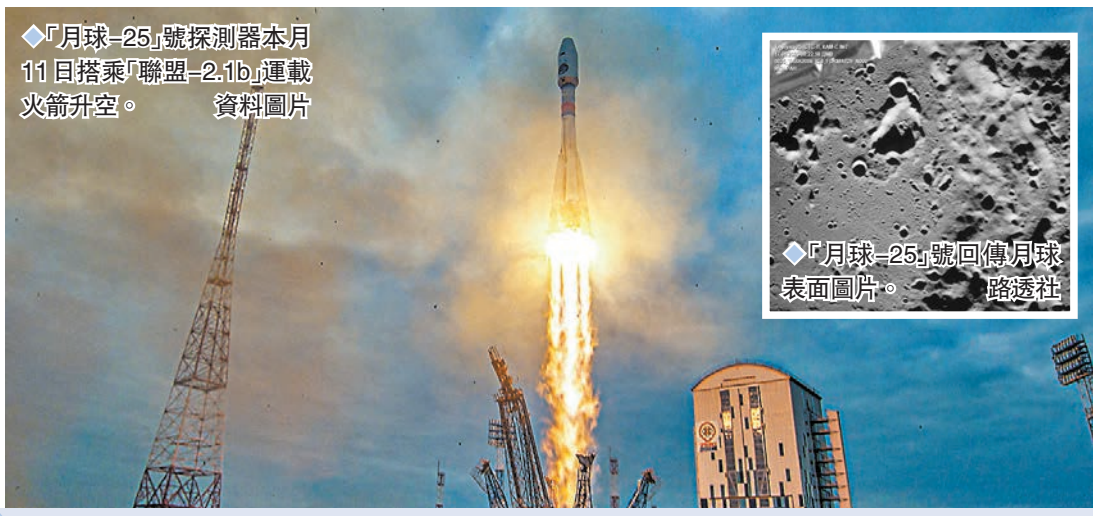
◆「月球-25」號探測器本月11日搭乘「聯盟-2.1b」運載火箭升空。資料圖片

然而俄國家航天集團上週六稱,探測器原本當天下午啟動指令,執行變軌控制進入著陸準備軌道,但在操作過程中,探測器出現異常情況,導致無法按照規定參數進入預著陸軌道,地面與探測器的通訊中斷,相關部門搜尋探測器並試圖與其取得聯繫但未果,控制專家組正對相關情況進行分析。