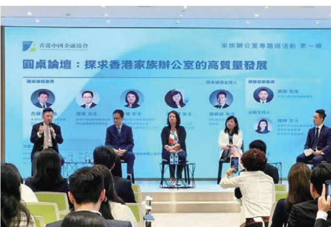
◆嘉賓們於論壇上探討香港家族辦公室的高質量發展。

在圓桌論壇環節中，四位論壇嘉賓分別從香港政府、高等院校、金融業界和專業服務機構等各自所在的領域進行多角度分享，期間講解了香港政府家族辦公室政策新發展、亞洲家族辦公室發展前景和趨勢、家族辦公室的專業投資機構特徵和業務情況、香港家族辦公室稅務優惠和合規操作等，探討了發揮優勢吸引家族辦公室進駐香港、構建香港家族辦公室生態圈並促進家族辦公室高質量發展等情況。各嘉賓均表示，香港家族辦公室發展有底氣，對其前景充滿信心。