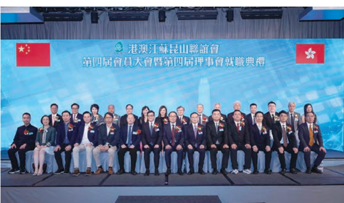
◆就職儀式上主禮嘉賓與第四屆理事會成員大合照。

港澳江蘇昆山聯誼會第四屆會員大會暨第四屆理事會就職典禮日前於香港唯港薈酒園圓滿舉行。陳燕雄連任新一屆會長，香港保安局局長鄧炳強，蘇州市委常委、統戰部部長王颯，江蘇省委統戰部港澳處副處長盧東，昆山市委常委、組織部部長、統戰部部長孫勇，張家港市委常委、組織部部長、統戰部部長朱曉，姑蘇區委常委、組織部部長、統戰部部長陸德峰，蘇州市委統戰部副部長鄧兵，中央政府駐港聯絡辦社團聯絡處處長陳曉林，中央政府駐港聯絡辦九龍工作部處長胡廣培，紫荊雜誌社副社長袁健，香港江蘇社團總會會長姚茂龍，香港立法會議員盧偉國、陸頌雄、梁文廣，港澳江蘇昆山聯誼會榮譽顧問、香港酒店業主聯會執行總幹事徐英偉，香港大學護理學教授陳肇始，油尖旺民政事務專員余健曦，香港蘇州總會會長馬忠禮，香港蘇州總會會長孫熾，澳門蘇州聯誼會會長徐佩等應邀擔任主禮嘉賓，冠蓋雲集，共襄盛會。