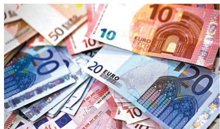
◆歐元兌美元上週五一度跌至1.0843，創一個多月低位，最近一次低位為7月6日的1.0832。圖為歐元貨幣。資料圖片

紐元上週跌見至九個月低位0.5901美元。技術走勢而言，圖表見RSI及隨機指數已處於20下方嚴重超賣區域，預計紐元兌美元下跌壓力短期內可望有所減緩。上方較近阻力預估在0.60及25天平均線0.61水平，下一級看至0.63水平。至於下方支持回看0.59水平，近三個交易日亦可勉力守住此區，較大支撐將指向0.5840以至0.5800水平。