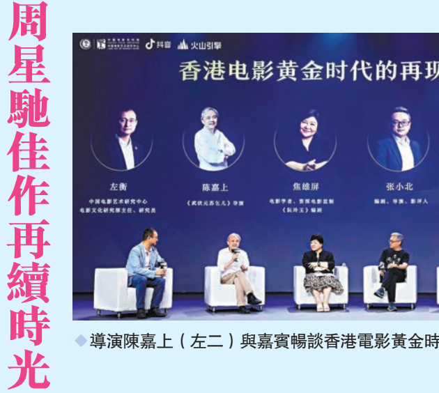
導演陳嘉上(左二)與嘉賓暢談香港電影黃金時代。

新華社電 借助人工智能，100部香港經典電影將被4K修復，其中《武狀元蘇乞兒》的4K修復版本16日在中國電影資料館與觀眾見面。本次修復工作由中國電影資料館對膠片進行物理修復和數字化處理，火山引擎提供人工智能修復技術支持，雙方共同完成藝術修復。中國電影資料館、抖音和火山引擎16日在北京共同啟動「經典香港電影修復計劃」，將在一年內把100部香港電影修復為4K版本。中國電影資料館副館長張小光介紹，電影修復是一項世界性課題，是保護電影遺產的重要舉措，借助先進的技術，膠片現在得以進行數字化保存和應用。此次計劃修復的香港電影製作時間集中在20世紀七十年代到九十年代，涵蓋成龍、周星馳、陳嘉上、徐克等多位知名演員、導演的作品。目前，《武狀元蘇乞兒》等首批修復的22部電影已上線。香港導演、金像獎前主席陳嘉上對修復團隊的工作表示感謝。他認為，《武狀元蘇乞兒》對自己非常重要，因為這是他第一部回到內地拍攝的電影，是一部關於民族文化的古裝片。通過這次電影製作，他的電影從內地深厚的文化底蘊中汲取素材，填補了電影在文化上的短板。台灣電影學者焦雄屏認為，這一時期的香港電影在電影史上具有非常獨特的位置，甚至影響了世界電影市場及製作標準。導演、編劇張小北說：「我們這一代人，對於香港電影最早的記憶都是在煙霧繚繞的錄像廳，看着非常模糊的錄像帶，由此被帶領着走入電影世界的大門。老電影的修復能讓年輕人也有機會體驗那個年代經典電影的魅力。」