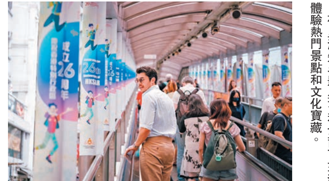
荷里活知名影星亨利戈爾丁來港體驗熱門景點和文化寶藏。

隨着疫情過後旅客出遊和消費模式發生改變，追求深度及多元化的體驗，旅發局未來會繼續邀請不同人士訪港，「親身體驗，眼見為實」宣傳香港旅遊。