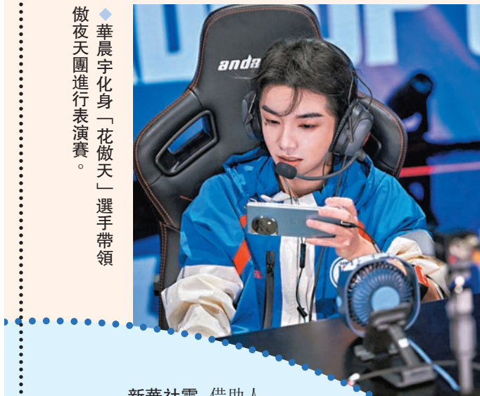
華晨宇化身「花做天」選手帶領 做夜天團進行表演賽。