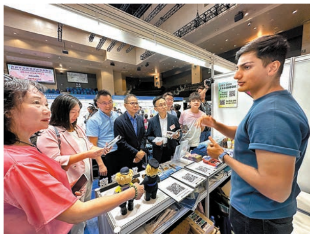
◆共創多元文化工作間招聘會現場。

為提升非華裔青少年的中文語文能力，特別是有興趣加入警隊或其他政府部門的有志者，警務處於2013年展開「寶石計劃」。洪嘉偉表示，在2021年疫情最嚴峻之時，「寶石計劃」小隊頻頻出動，協助保安局