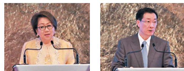
◆港交所主席史美倫 中證監副主席李超