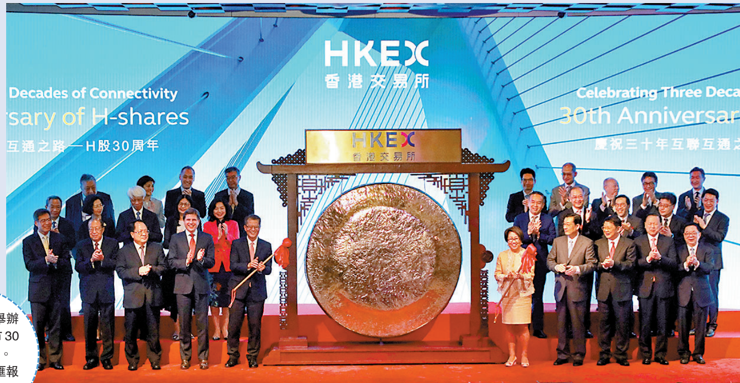
◆港交所昨舉辦H股在港上市30周年慶祝活動。