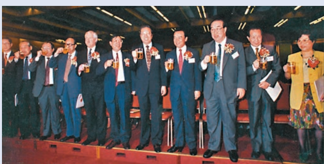
◆1993年7月15日，青島啤酒成為第一家在香港上市的H股。 資料圖片

陳茂波認為，大中華地區的證券市場還會長足進步，因為港股市值目前僅佔國家的GDP約27%，加上深交所和滬交所，合共也只佔國家GDP約96%。在美國，紐交所和納斯達克兩所的股票，合共大約是美國GDP的170%。在國家經濟高速發展下，相關證券市場未來的發展空間還是很大的。