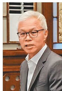
◆香港故宮文化博物館館長吳志華。

香港文匯報訊（記者 江鑫嫻、實習記者 蘇雨潤 北京報道）香港故宮文化博物館（以下簡稱香港故宮館）「雙城青年文化人才交流計劃」昨日在故宮博物院舉行交流活動。談到香港故宮館的票價上漲問題，該館館長吳志華在活動前接受訪問時表示，上調票價除為解決財政問題外，還有一個非常重要的原因，就是為了保持香港故宮館的高水平展覽，而票價上漲不會影響博物館可持續發展。他還透露，明年香港故宮館會有10%的門票，通過機構贊助的方式給到一些低收入家庭。