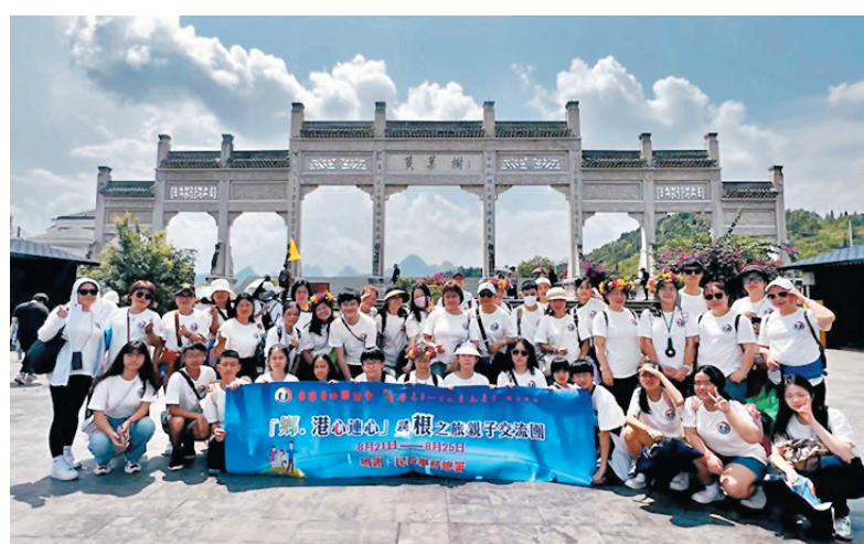
◆眾團員在黃果樹合影。

香港文匯報訊（記者 子京）香港貴州聯誼會和香港貴州文化交流基金聯合舉辦「鄉·港心連心」尋根之旅親子交流團，組織基層學生和會員子女共40人，於本月21日從香港出發到貴州，展開一連5天的交流活動。一眾團員在昨日參觀了黃果樹名勝風景區，感受祖國山河的壯麗景色。今日大家將到貴州的知名學校參觀，並與當地師生互動。