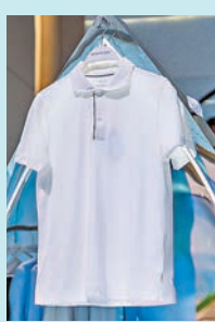
◆ InstantCool 系列