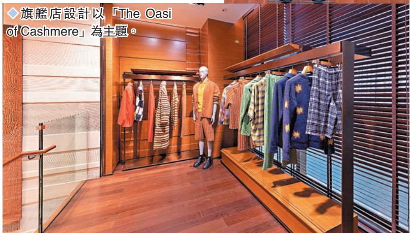
◆ 旗艦店設計以「The Oasi of Cashmere」為主題。

加上，部分造型來自品牌與洛杉磯生活方式品牌 The Elder Statesman 合作系列，The Elder Statesman 和 ZEGNA 於多個方面抱持共同理念，雙方均致力於精進製造工藝、採用優質材料、沿用大師級工匠以及與自然同步，衣物選用的羊絨更是纖維中的佼佼者，體現兩個品牌一絲不苟的精神。