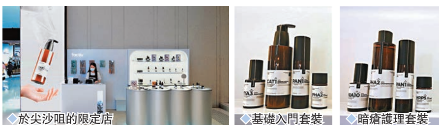
◆ 於尖沙咀的限定店