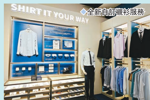
◆ 全新自訂襯衫服務