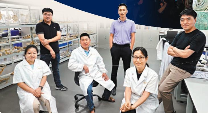
量絲網痕跡，令三星堆有「沉睡數千年，一醒驚天下」的美譽。

趙昊說，雖然考古界有傳統觀點將文字、冶金技術和政權，定義為進入文明社會的標準，亦稱「文明三要素」，但他認為，沒有文字流傳的三星堆文化也可能是一種文明。「文明是一種人為的定義，各個地區的文明會有所差距，三星堆現在沒有發現文字，也許是記載習慣的差異，如果寫在絲綢和竹木上面，經過幾千年可能就流失掉了。」