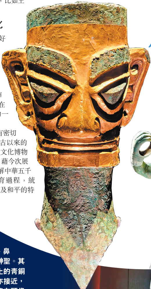
金面罩 青銅人頭像 1986年 三星堆出土文物

出土於3號祭祀坑，眉眼鏗空、兩耳輪廓圓潤、鼻樑高挺，造型威嚴神聖。其面部特徵與此前出土的青銅人頭像一致，尺寸亦接近，專家推測可能是覆蓋在頭像面部的一部分。