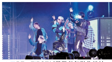
BE:FIRST以勁歌熱舞融化粉絲。

由安樂影片有限公司送出《長安三萬里》電影換票證30張予香港《文匯報》讀者，有興趣的讀者們請剪下《星光透視》印花，連同貼上$2.2郵票兼註明索取「《長安三萬里》電影換票證」的回郵信封（填上個人電話），寄往香港仔田灣海旁道7號興偉中心3樓副刊部，便有機會得到換票證戲飛兩張。先到先得，送完即止。