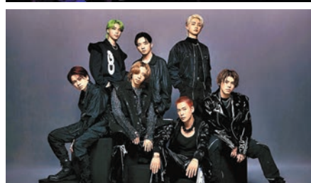
BE:FIRST首部電影《BE: the ONE》明天在香港上映。