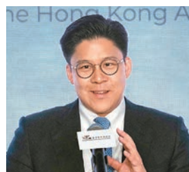
◆霍啟剛指杭州亞運會是港將展現自我的機會。 資料圖片