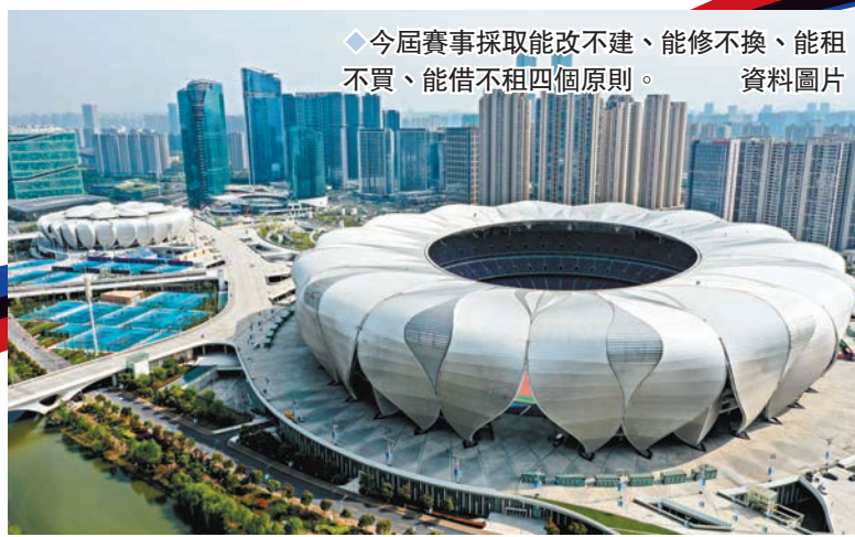
◆今屆賽事採取能改不建、能修不換、能租不買、能借不租四個原則。

今屆亞運40個大項當中除了包含游泳、田徑及三大球等奧運項目，亦有武術、柔術及藤球等極富亞洲傳統文化的運動，更新增設霹靂舞及電競兩項新興項目，將傳統體育、亞洲文化及新潮流揉合成一場精彩刺激的體育盛宴，其中電競項目無論場上場下均備受注目，據統計亞運中國運動員社交平台互動排行榜之中，頭10位就有7位是電競運動員，作為比賽場地的杭州電競中心更被喻為現實版的「星際戰艦」，內置超現實的舞台效果為觀眾提供沉浸式的觀賽體驗，場館更由AI智能大腦所掌控，充滿未來科技感。