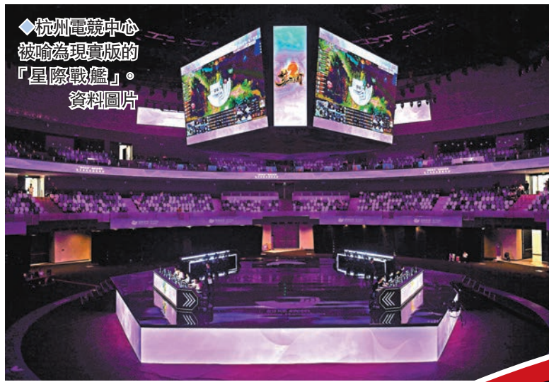
◆杭州電競中心被喻為現實版的「星際戰艦」。

而5G技術亦實現了跨語種交流與自由流暢溝通，新語法及即時翻譯技術讓整個運動會的管理更具效率以及精細化，而且天氣及交通等所有數據均會由AI「大腦」全天候監測及管理，確保杭州亞運每個細節都流暢無阻。