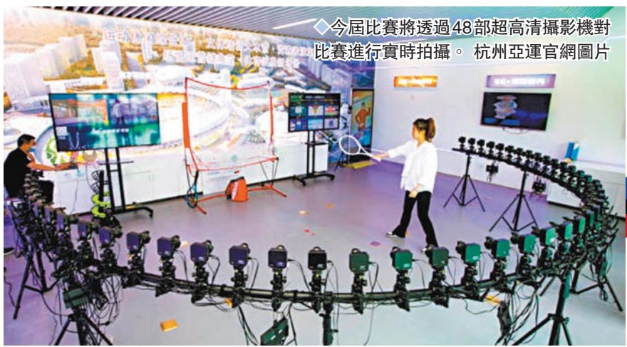
◆今屆比賽將透過48部超高清攝影機對比賽進行實時拍攝。

杭州亞運共設有40個大項、61個分項合共481個小項，亞洲45個國家及地區奧委會全數報名，有12,000名運動員將會參賽，破盡歷屆亞運會紀錄，而多個國家及地區均派出史上最龐大的代表團出戰，中國、日本、韓國、印度、泰國及中國香港報名運動員均超過600人，包括港隊將派出930人代表團到杭州，當中有681名運動員，力爭打破上屆亞運8金18銀20銅的紀錄。