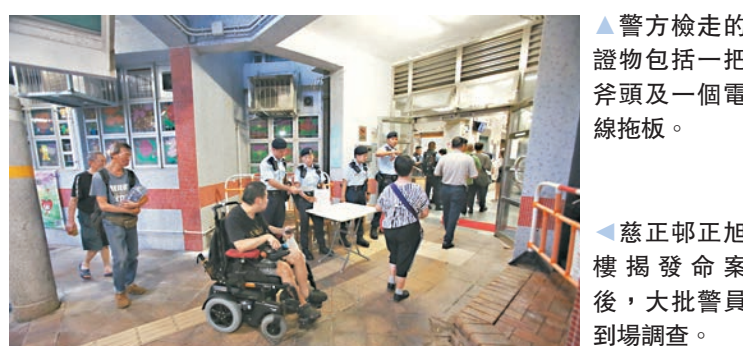
▲慈正邨正旭樓揭發命案後，大批警員到場調查。