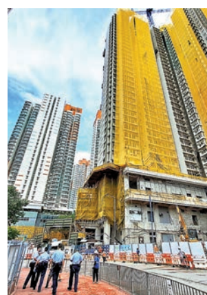
◆石硤尾白田邨重建地盤發生墮石擊傷途人後，警方封鎖現場防止其他途人接近。

香港文匯報訊（記者 蕭景源）舊樓屎石屎釀成的「空中危機」頻發。多次發生屎石屎的灣仔區，昨日又有舊樓發生同類事故。有46年歷史的灣仔金聲大廈，於3個月前收到屋宇署強制驗樓通知，正展開相關程序。昨日上午，大廈有屎石屎從20樓單位的外牆剝落，擊中大廈低層簷篷及玻璃窗，再反彈跌落謝斐道路面，幸無途人被擊中，有關住戶被警方帶走助查。