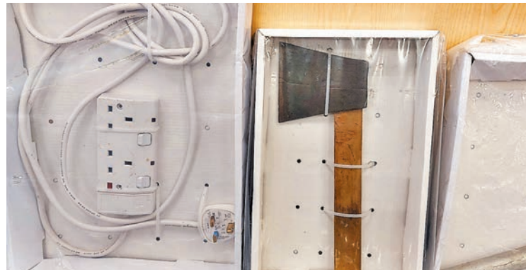
▲警方檢走的證物包括一把斧頭及一個電線拖板。