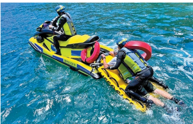
◆水警出動水上電單車迅速將墮海事主救起。

根據警方紀錄，水警東分區於去年共接獲76宗水上活動意外個案，合共救助167人，其中10人不幸死